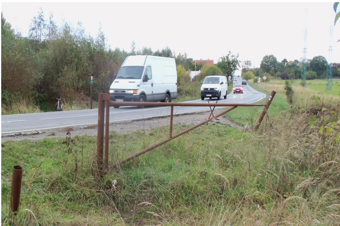
Pohled z nebezpečného místa směrem na H. Počernice po I. odstranění clonící zeleně.

Podstatné zlepšení umožní až dokončení II. etapy cyklostezky Běchovice – H. Počernice, které nabídne možnost pohybu podél většiny této nebezpečné komunikace a nabídne i variantu jejího výrazně bezpečnějšího přechodu u nedaleké běchovické obalovny firmy Porr a.s. – potom již s návazností.