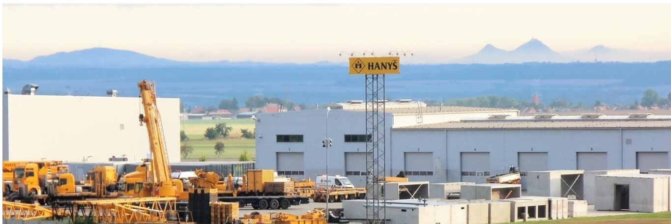
Počernické severovýchodní zátiší s protáhlou Vrátenskou horou, homolemi Bezdězu a vzdálenějším Ralskem.

Pokud si na zpáteční cestě chcete projet Kokořínskem a nasednout si v Liběchově na zpáteční vlak, bude výlet dlouhý 81 km a pojedete zajímavou trasou - http://www.mapy.cz/s/kCxy .