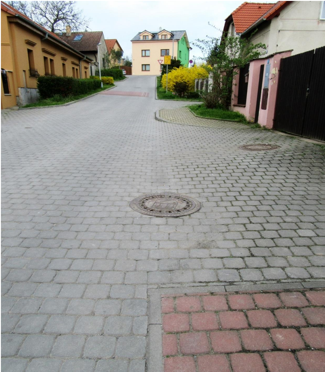
Stoupání ve Špechnerově ulici, nahoře Vás čeká ulice Božanovská.

Sklon Šplechnerovy ulice je největší v jejím závěru, kde se kříží s hlavní, poměrně frekventovanou Božanovskou ulicí. Je zde sice přechod pro pěší, ale pozor na to místo včetně přejezdu do zpočátku úzké ulice Mezilesí.