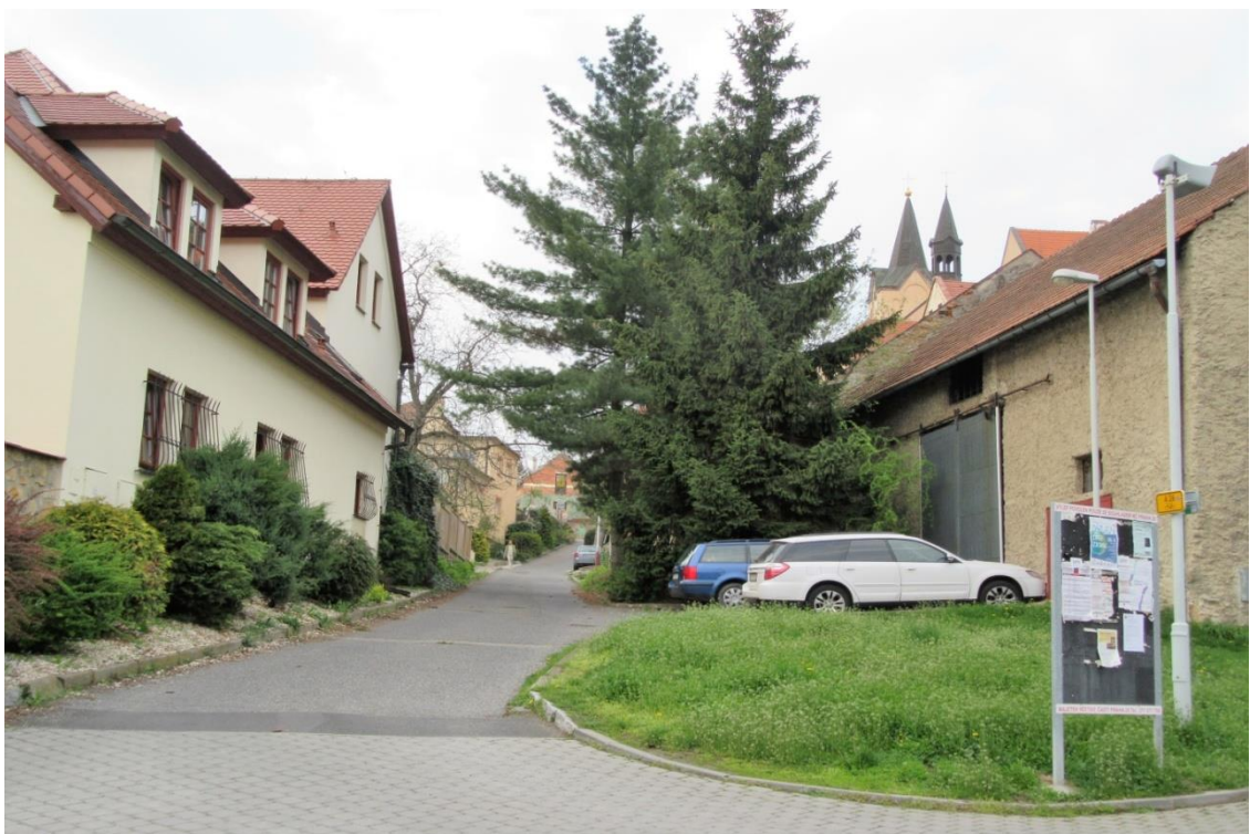
Řešetovská ulice s vyčnívajícími věžičkami Kostela sv. Ludmily

Po předchozích sídlištích v Hloubětíně, na Černém Mostě a jeho betonové těžkopádnosti se Vám zde - v příjemném tzv. Chvalském podhradí určitě zalíbí. Nad sebou přitom máte pro veřejnost přístupný Chvalský zámek se zajímavými výstavami a IC (provoz je zde bohužel omezen do konce června 2016), vlastně celý obnovený areál i s možností kvalitního odpočinku, případného občerstvení.