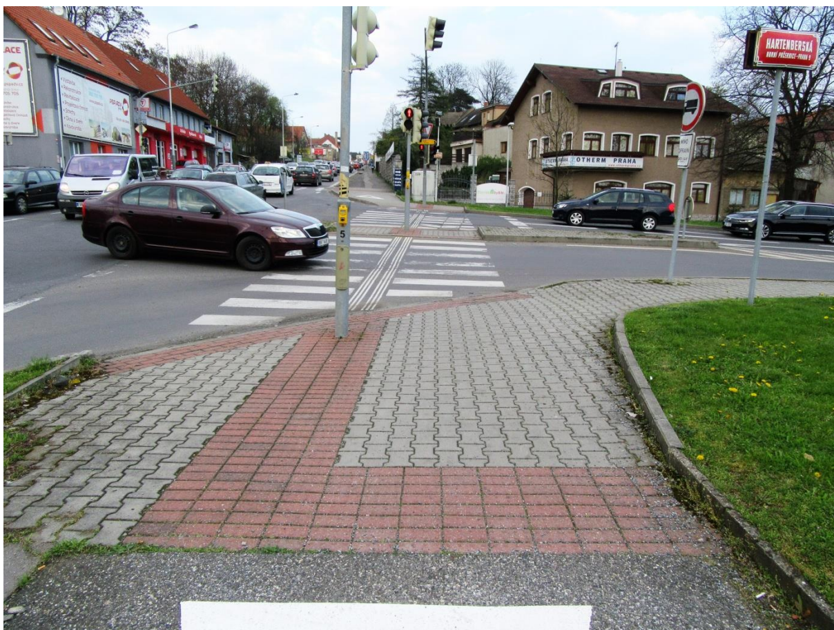
Přechod přes Hartenberskou ulici