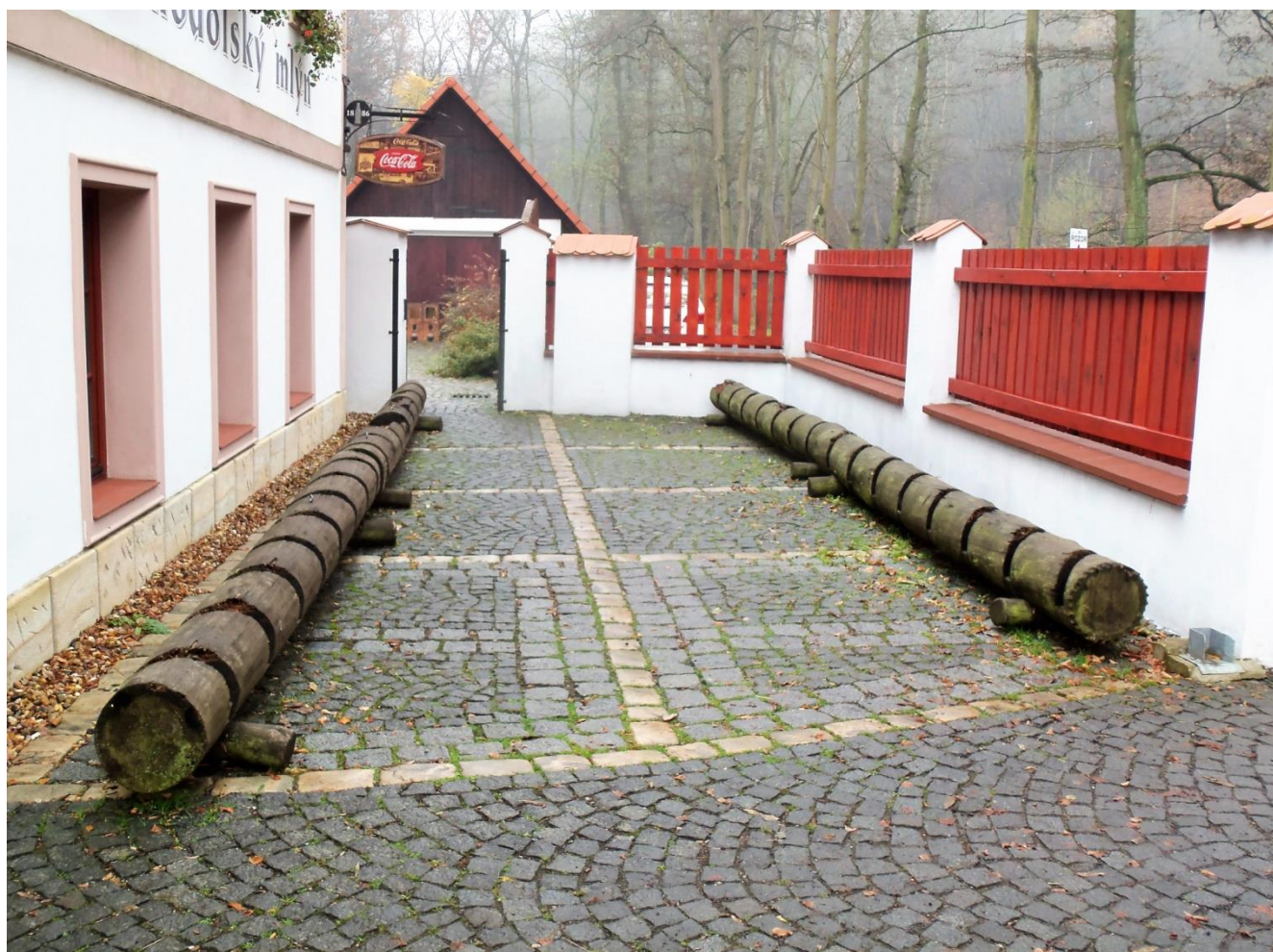
Podolský mlýn v závěru Opárenského údolí je na cyklisty dobře připraven.