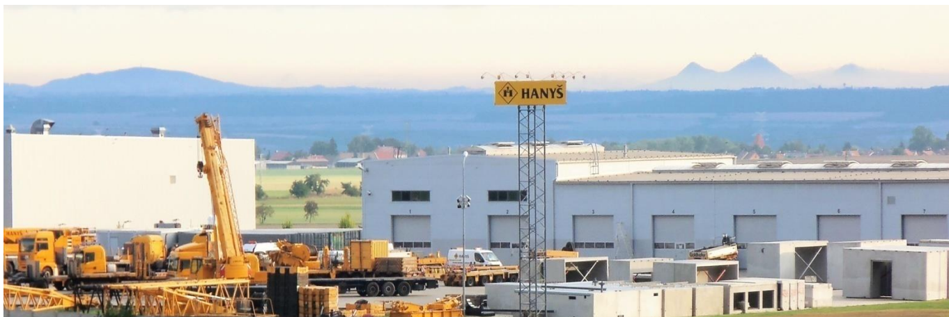
Počernické severovýchodní zátiší s protáhlou Vráteňskou horou, homolemi Bezdězu a vzdálenějším Ralskem.

Pokud si na zpáteční cestě chcete projet Kokořínskem a nasednout si v Liběchově na zpáteční vlak, bude výlet dlouhý 81 km a pojedete zajímavou trasou - http://www.mapy.cz/s/kCxy .