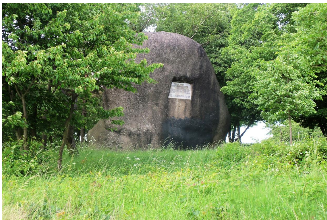
Některé kameny nám předci na Klepci přece jenom zanechali