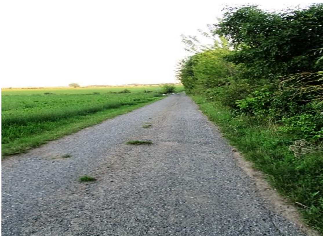
jedete podél D-10, v létě jste odcloněni zelenou stěnou