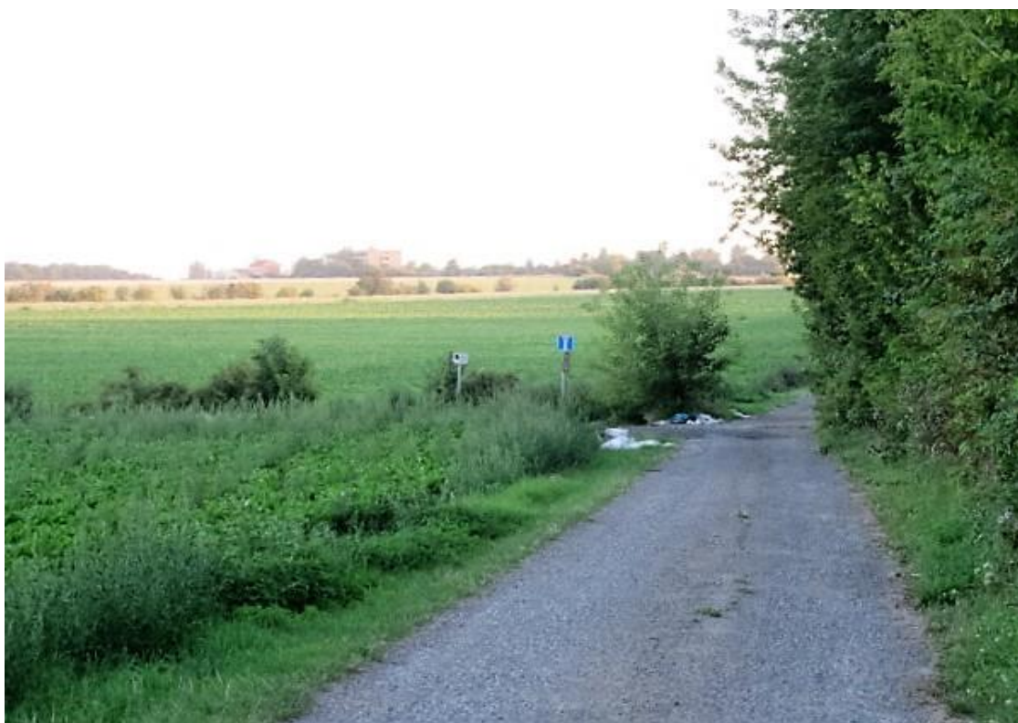
na první, zatím zanedbané, odbočce jed'te vlevo