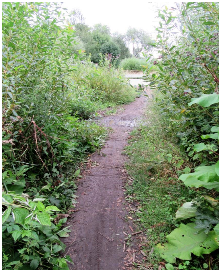
Nyní je zde cesta opět zarostlá.