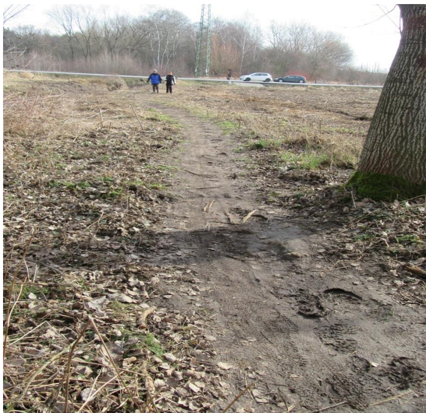
Dnes již historický snímek, občasné holoseče.