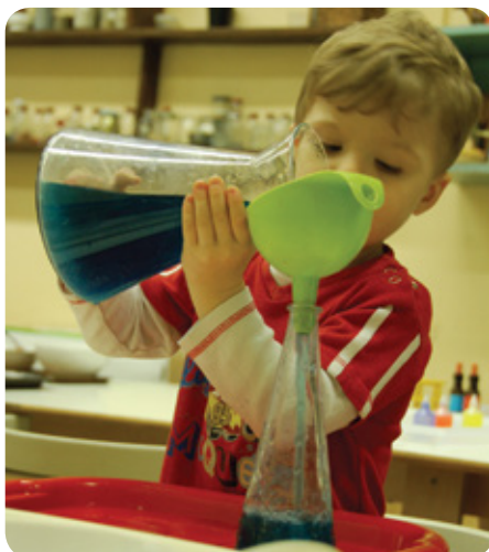
Montessori aktivity si můžete vyzkoušet i vy. Na Montessori inspiraci pro rodiče s dětmi nebo na Montessori sobotě.

Vaše děti přespí v MUMu a vy se můžete věnovat sami sobě. Pro děti od 5 let. O vaše děti budou pečovat zkušené chůvy.