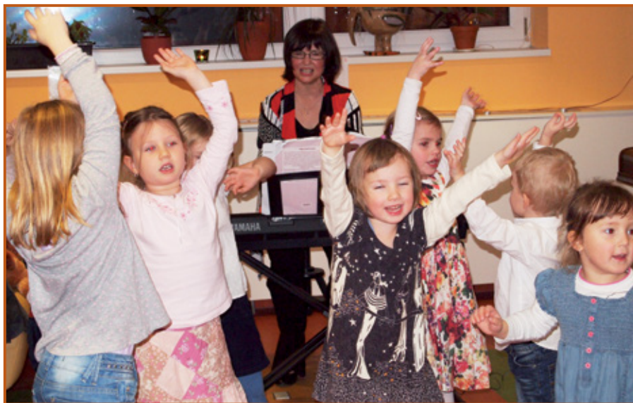
Vystoupení dětí z kroužku Píseňkovaní v kavárně Maňána na Černém Mostě