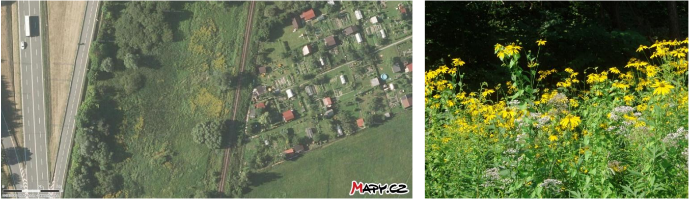
Obr. 3. Třapatka dřípatá na leteckém snímku pořízeném nad Frýdlantem nad Ostravicí a detailní pohled na rostlinu. Při snaze rozlišit ji z leteckého snímku by mohla být zaměněna za také ve stejnou dobu žlutě kvetoucí zlatobýly.

Invazní druhy se šíří rychle. Rychle se ale vyvíjí i metody jejich studia a mapování. Způsoby dálkového průzkumu jsou velice efektivní a mapování z menší výšky pomocí dronů bude ještě přesnější. I přesto ho ale nelze použít na všechny druhy. Nehodí se pro rostliny příliš malé, nezachytí ty rostoucí v podrostu lesa a nepůjde podle něj rozlišit navzájem si podobné druhy a rody. Terénní pozemní mapování tak bude potřeba pořád. Jedno takové probíhalo podél malých vodních toků v okolí Prahy v minulém roce v Ekocentru Koniklec. Financováno bylo grantem Hlavního města Prahy. Více informací naleznete na webových stránkách projektu: http://www.ekocentrumkoniklec.cz/monitoring-vybranych-invaznich-rostlin-prahy-a-blizkeho-okoli/ .