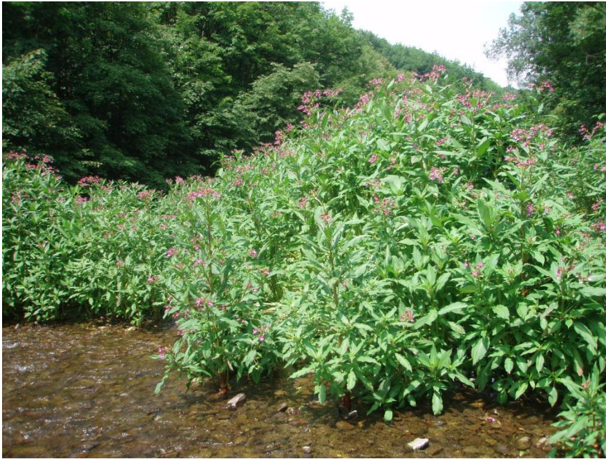
Obr. 1. Netýkavka žláznatá, druh snadno rozpoznatelný a viditelný už na velkou vzdálenost.

Invazní rostliny jsou druhy na daném území nepůvodní. Byly do něj člověkem jak neúmyslně zavlečené, tak záměrně dovezené a nejčastěji pěstované třeba jako rostliny okrasné. Snadno se rozmnožují, rychle se šíří, osidlují pro ně příhodná stanoviště a vytlačují nebo jinak omezují druhy původní. Na druhotných stanovištích dokáží měnit jejich vlastnosti (např. změnou chemismu půdy) a negativně ovlivňují biologickou rozmanitost. Mnohé invazní druhy nezdědka způsobují hospodářské škody, svými monotónními porosty mění krajinný ráz a mohou zapříčinit zdravotní potíže, jako jsou pylové alergie či dotykové reakce.