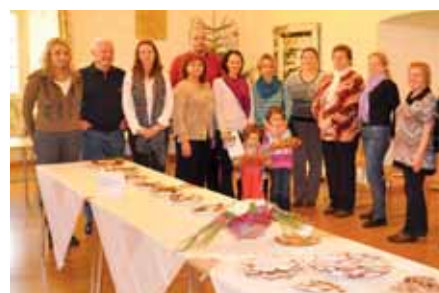
Soutěž byla maximálně vyrovnaná a všechno cukroví vynikající.