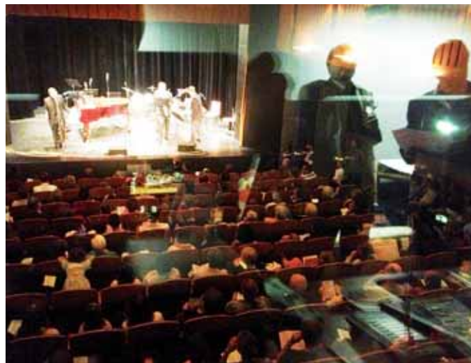
Koncert učitelů ZUŠ v hornopočernickém divadle