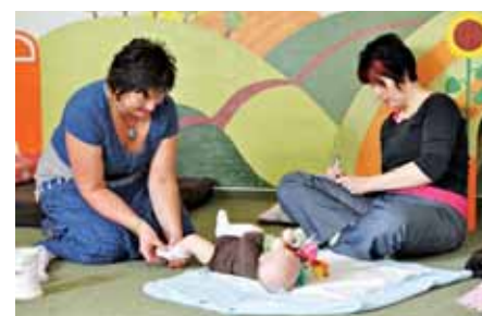
Masáže kojenců prohlubují vazbu mezi rodiči a dětmi.