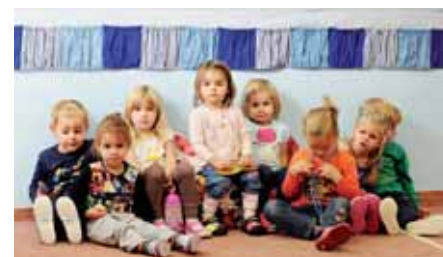
Školička pro děti 3 – 5 let. Nepropásněte zápisy na další pololetí.

Milí přátelé MUMu, přejeme vám šťastný nový rok 2013 a věříme, že budete s námi a my s vámi.