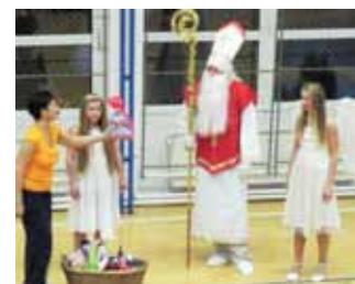
Vánoční závod v tělocvičně TJ Sokol Praha – Vršovice. Naše gymnastky získaly hned pět medailí.