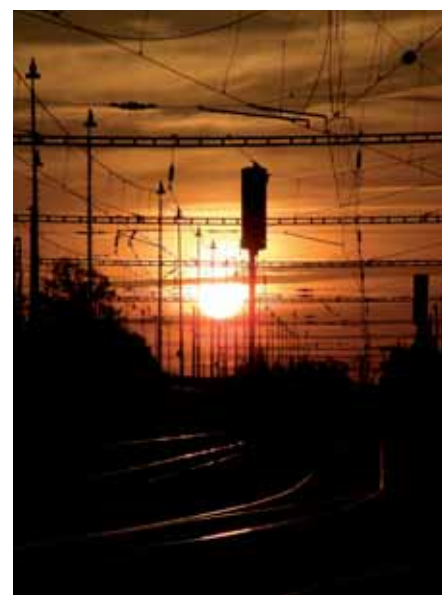
Vláda Kočíčka: Západ slunce nad nádražím, 3. místo

Zasláním odkazu ke stažení fotografie poskytuje účastník soutěže bezúplatně, nevýhradně, územně a časově neomezené oprávnění (licenci) k použití fotografie v rámci veškerých propagačních aktivit MČ Praha 20 a Chvalského zámku.