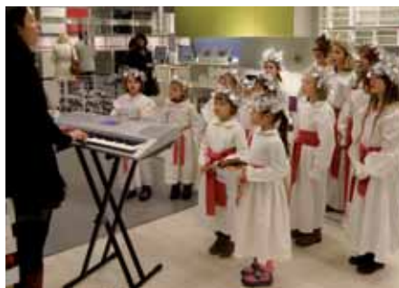
Pěvecký sbor Malíček zpíval před Vánocemi v obchodním domě IKEA.