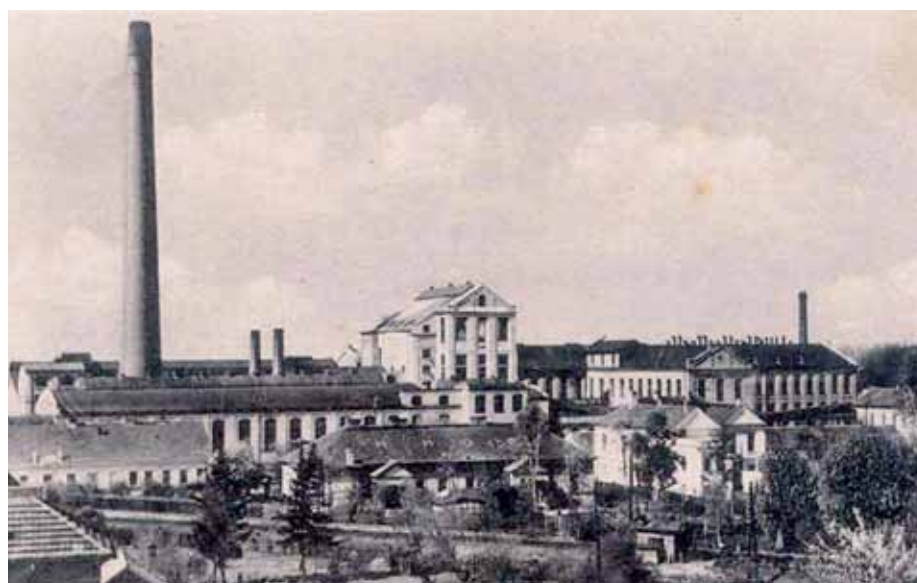
Čakovický cukrovar byl na přelomu 19. a 20. století největším cukrovarem v Čechách.