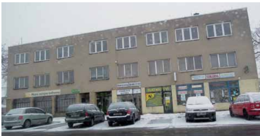
Budova na Náchodské 754 je konečně ve vlastnictví Prahy 20 a čeká ji rozsáhlá rekonstrukce.