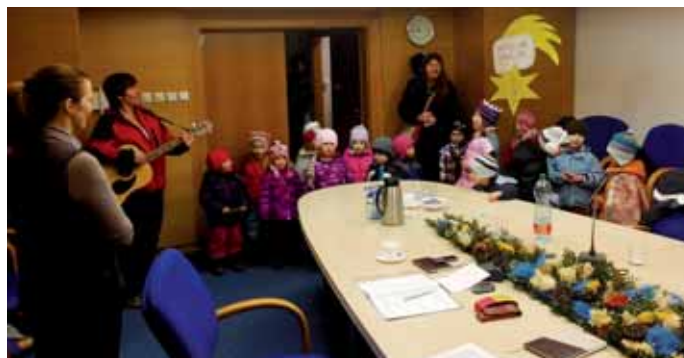
Tříkrálové zpívání dětí z MŠ Chodovická na lednovém zasedání radních