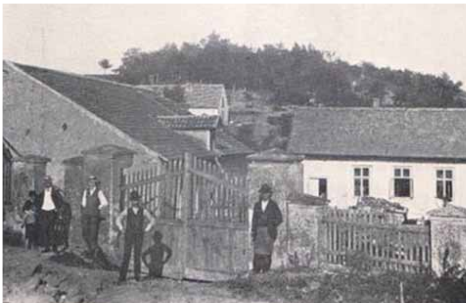
V roce 1908 zakoupila už nefunkční mlýn na Chvalech Církev bratrská a zřídila zde útulek pro opuštěné děti.