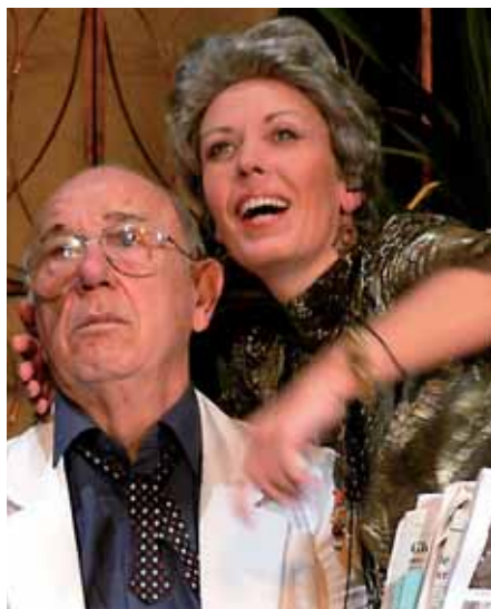
Poslední léto Sarah Bernhardt