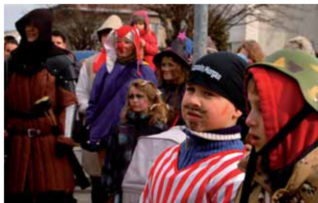
První zastávka maškar před radnicí