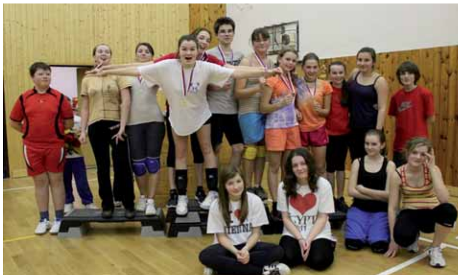
Vítězové nejstarší a nejprestižnější kategorie turnaje

Spoustu podobných herních situací zachytila naše fotografka Zuzanka Držmíšková.