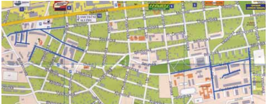
Blokové čištění na sídlišti I. Mezilesí a sídl. II. Lhotská se uskuteční v pátek 22. 3. 2013 od 8.00 do 14.00, na sídlišti III. Pavlišovská v pátek 29. 3. 2013 od 8.00 do 14.00.

V pátek 22. 3. 2013 od 8.00 do 14.00 bude prováděno blokové čištění sídliště I. Mezilesí a sídl. II. Lhotská, včetně přilehlých ulic - Libošovická, Běchorská /viz. situace v levé části mapky/. V pátek 29. 3. 2013 od 8.00 do 14.00 bude prováděno blokové čištění sídliště III. Pavlišovská, včetně přilehlých ulic U Jeslí, Ruprechtická, Ratibořická, Komárovská a Chodovická /viz. situace v pravé části mapky/. Další komunikace v obci budou čištěny v druhé polovině března a v průběhu dubna. Všechny čištěné úseky s parkujícími vozidly budou označeny dopravními značkami. Žádáme majitele vozidel, aby svou kázní přispěli k zajištění řádného úklidu komunikací po zimním období.