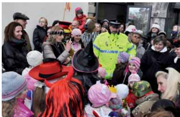
Která z maškar bude mít u poroty největší úspěch?