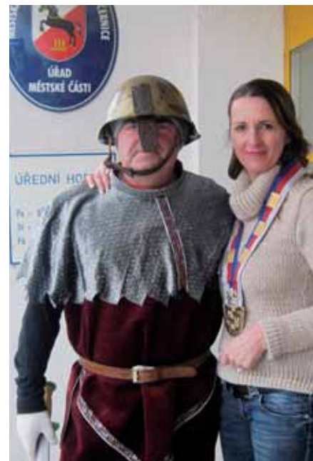
Masopustní právo bránili zbrojnoši.