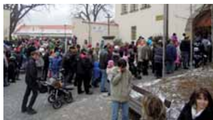
Masopustní průvod míří na zámek.