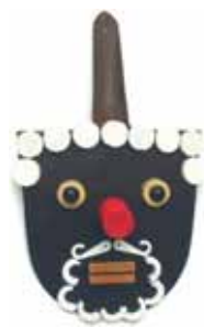
Strýček Tom s červeným nosem

Motto: Každá věc má svůj půvab, jde jen o to jej najít a využít. Takové hledání bývá leckdy napínavé, ale vždycky moc fajn, i když výsledek nemusí být nic extra. Doporučuji vám – zkuste to také!