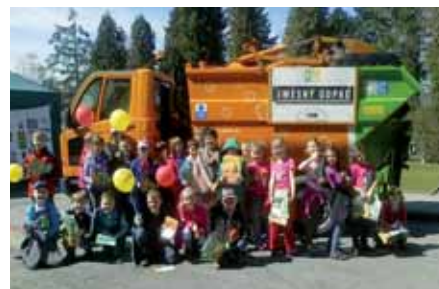
Den země oslavily děti v ŠD FZŠ Chodovická Včeličkovým dnem.