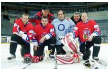
Na památku účasti na 8. ročníku turnaje Skybox Cup 2013 se hráči našeho týmu vyfotili v reprezentačních dresech se líčkem na prsou.

“Domácí kluziště – ZS Letňany je majetkem olympijského vítěze z Nagana 1998 Františka Kučery & spol. a domácí hřiště týmu HC Horní Počernice od jeho otevření v r. 2001. Pro hornopočernické hokejisty je to nejbližší ZS v Praze a patří vybavením k nejlepším v Praze. Jaká je ale budoucnost sportovní činnosti mladých v Horních Počernicích? “Jako vedoucí HC jsem i členem komise sportu Prahy 20 a věřím, že v blízké budoucnosti se po ztrátě fotbalového hřiště Xaverova podaří prosadit postavení víceúčelové sportovní haly. Doufám, že se zde najde také plocha na menší kluziště pro radost dětí, mládeže i dospělých.