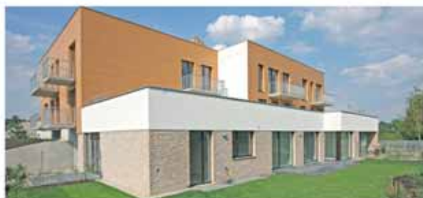
Bytový projekt „Krásné Počernice“ 44 bytů + 1 rodinný dům