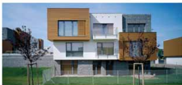
Rezidenční projekt „V lukách“ oceněn jako Stavba roku 2008 , 31 bytů, 20 rodinných domů

DĚKUJEME ZA SPOLUPRÁCI, DŮVĚRU A VSTŘÍCNOST A PŘEJEME VŠECHNO NEJLEPŠÍ DO NOVÉHO ROKU 2014!