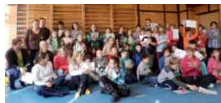
Sportovní den v Bártlovce