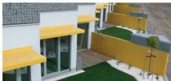
Bytová výstavba „Nové Počernice“ 107 bytů včetně 5 unikátních domů v zemi, 6 rodinných domů