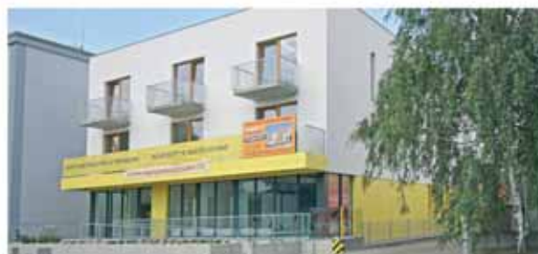
Bytový dům „Na Kopečku“ 11 bytů, 4 nebytové prostory