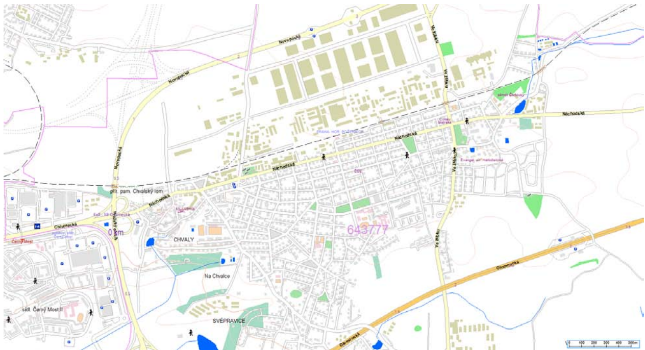
Obrázek 6 - nehody chodců na území MČ Praha 20 v roce 2013