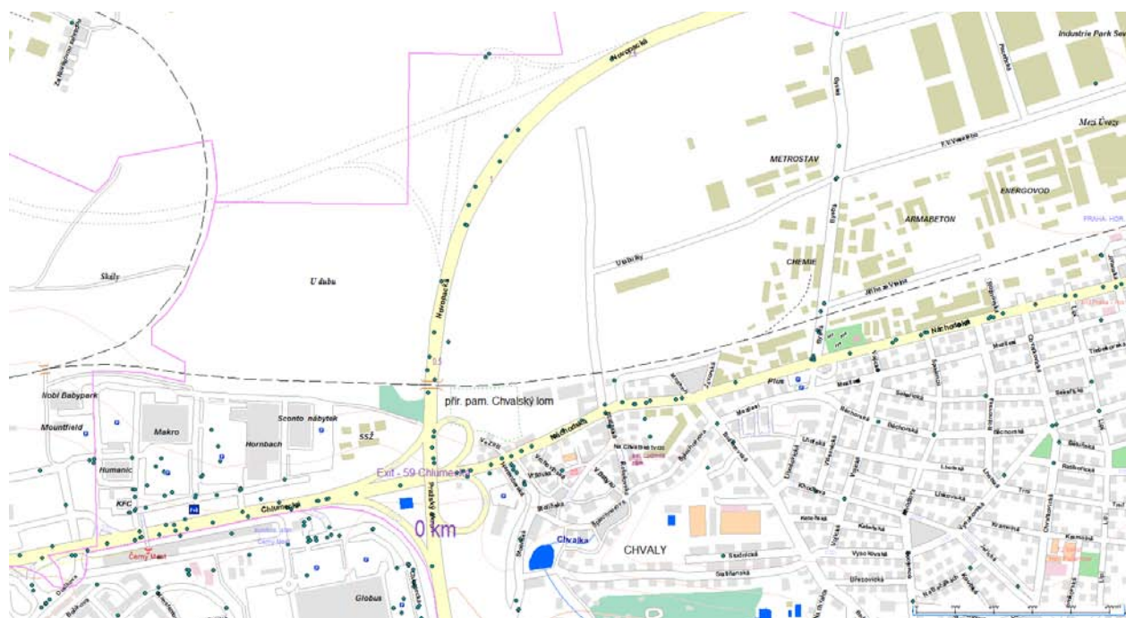
Obrázek 1 - nehodovost na území MČ Praha 20 v roce 2013

Na obrázcích níže jsou zobrazena místa dopravních nehod šetřených Policií ČR podle souřadnic GPS a rovněž místa dopravních nehod s účastí chodců.