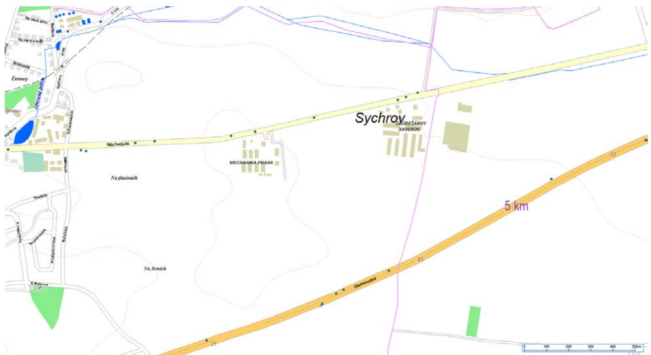
Obrázek 3 - nehodovost na území MČ Praha 20 v roce 2013