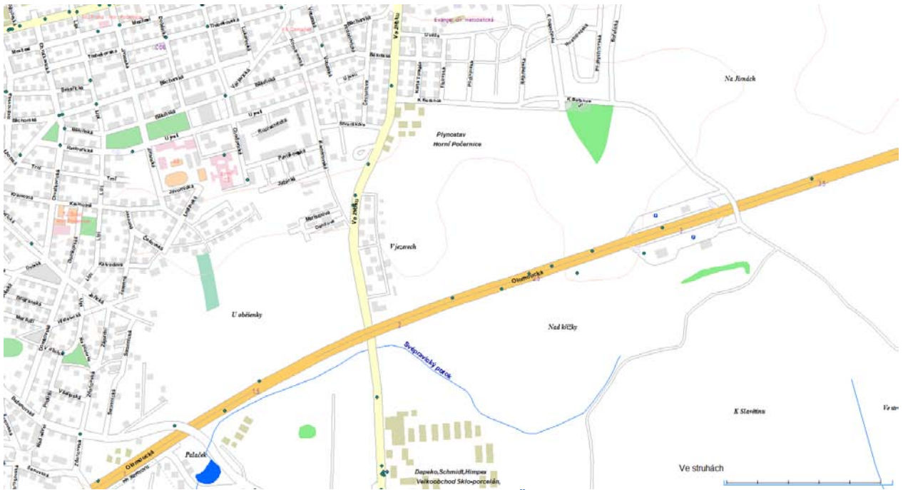
Obrázek 4 - nehodovost na území MČ Praha 20 v roce 2013