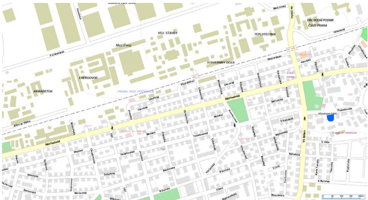
Obrázek 7 - nehody chodců na území MČ Praha 20 v roce 2013

V případě potřeby dalších informací volejte na tel. č. 974 825 821, případně nás kontaktujte e-mailem: krpa.osdp.podateln@pcr.cz .