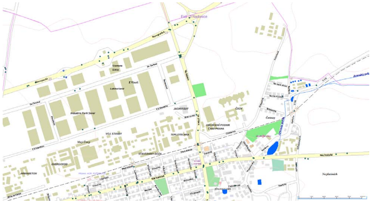
Obrázek 2 - nehodovost na území MČ Praha 20 v roce 2013