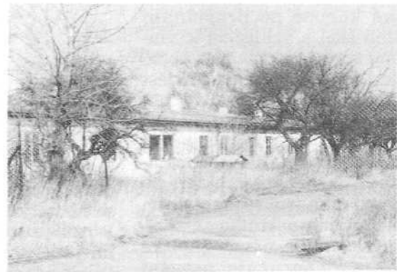
Autopark - Chvaly