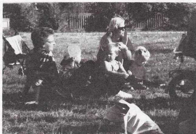
piknik v trávě