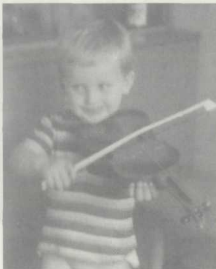
První hudební krůčky