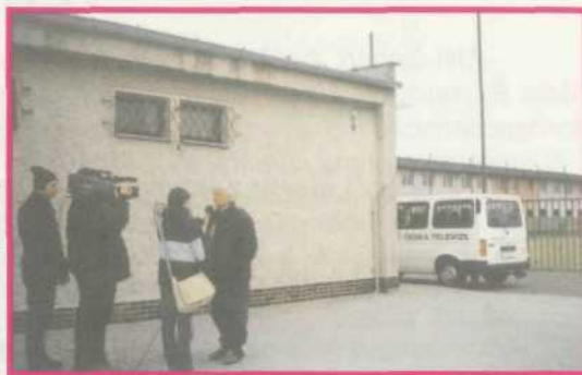
Hornopočernický Xaverov v centru zájmu médií nejen lokálních - přijela i ČT

POZVÁNKA do bývalého kina, aktuálně našeho „bezejmenného“ hornopočernického divadla na koncert tří hudebních těles.