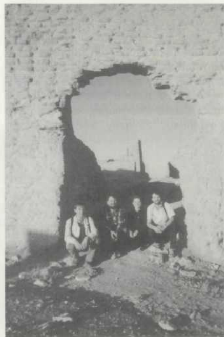
Musica Gaudeans ve světě

Tak to záleží na každém pedagogovi jak bude vytižený. Může si udělat přípravy a pak je po léta používat, vlastně jet podle nějakého mustru. Nebo může vyměřet různý věci, jako třeba kapelu, což vřdycky vidíte na Čarodějnicích. Pro tu musím pokaždé psát dle složení, upravovat tak, aby to žáci zahráli, což někdy trvá dost dlouho, sebere to hodně času. A další - v „ZUŠce“ mám podle možnosti kytarová