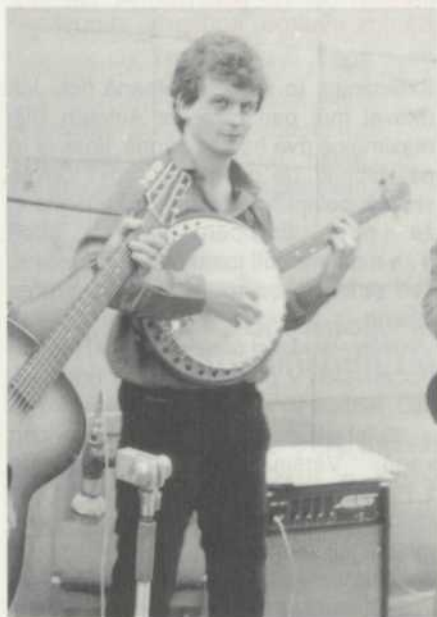
Jsem to já (jak) zamlada..

Jasně. Logicky, půl roku dopředu to piluji, brousím, nemluvě o finále dva tři týdny před premiérou. Co se týče uspávání, tam má hudba opačný efekt. Nehledě na to, že když přicházím domů, většinou už dcery, jak jsem řekl, dávno spí.