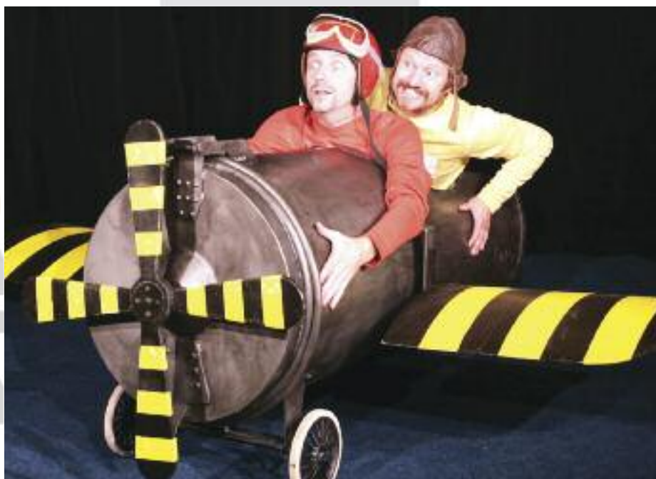
Dva kluci se smyslem pro legraci a dobrodružství: PŘÍBĚHY Z POPELNICE

Vždycky je riskantní, neřku-li nebezpečné dělat si ze životního partnera důvěrníka. Vyžadovat upřímnost, to je začátek vážné revize vztahu, vzájemného podezírání