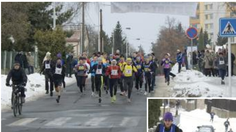
Čtyřicet čtyři běžci se vydávají na 6 300 metrů dlouhou trať Novoročního běhu.