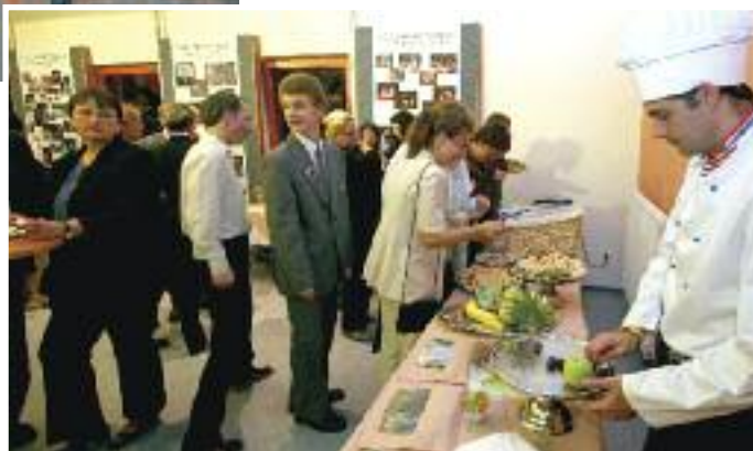
Foyer divadla je příjemným prostorem pro společenské a kulturní akce.