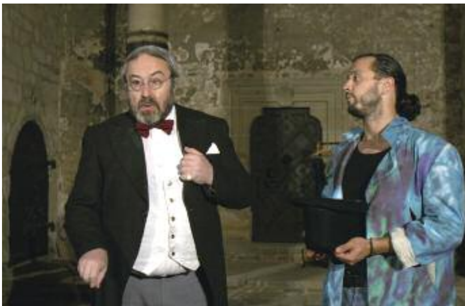
DS Tyjáter: DON JUAN ANEB KAMENNÁ HOSTINA

/Internetové rezervace najdete v sekci Jiní pořadatelé/.