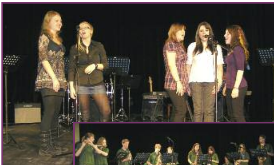
Pěvecký soubor Mozaika