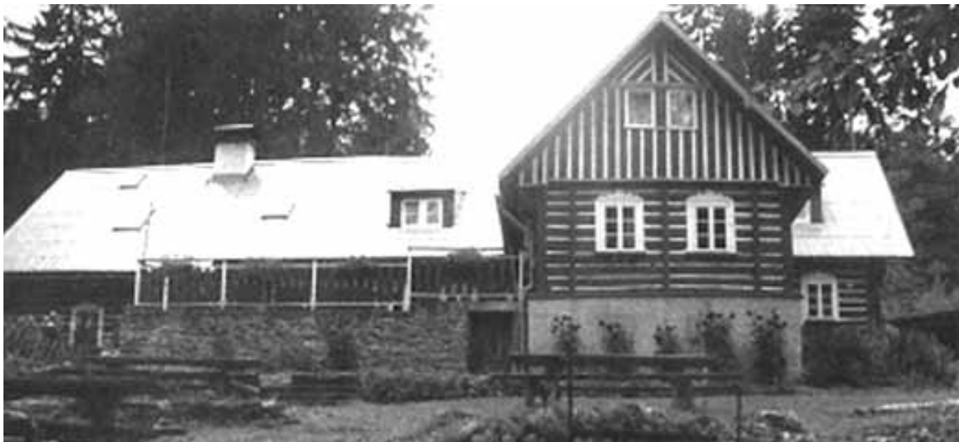
Zde budeme trávit hezké chvíle letního tábora (chata ve Vítkovicích).