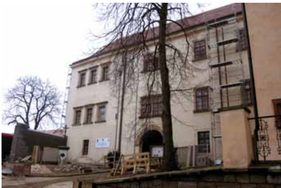
Stavební práce ve Chvalském zámku pokračují.

Stavební práce v zámku pokračují, někdy z překvapení, jakým bylo třeba objevení zazděného točitého schodiště, o kterém není nikde zmínka. Pro badatele bude jistě zajímavé pátrat, proč bylo kdysi uzavřeno a jaká historie se k němu váže. Chvalský zámek je posledním významným objektem ve vlastnictví naší obce, který se nepodařilo v uplynulých letech opravit. Je významným dědictvím naší minulosti a dokladem historie na našem území. Pro mě je věcí hrdosti na téměř tisíciletou historii mé obce, aby její nejvýznamnější historická kulturní památka byla v pořádku a mohla sloužit příštím generacím. DM