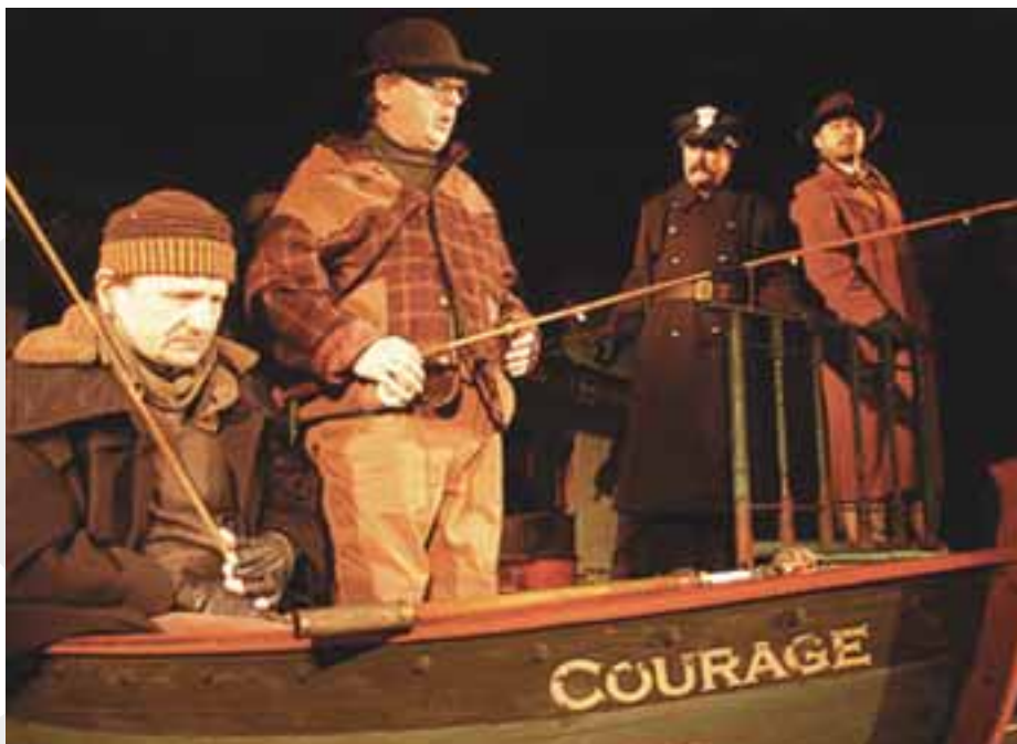
Představení Irwina Shawa Brooklynská Idyla