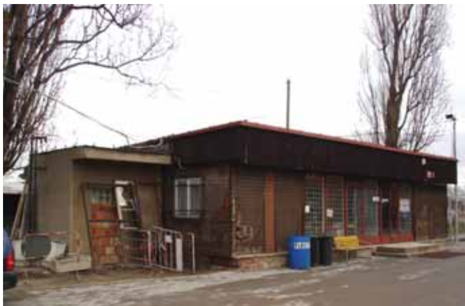
Dlouhá léta měli zaměstnanci místního hospodářství kanceláře a zázemí ve velmi provizorních a nevyhovujících prostorách.

Na jednání Rady naší městské části v závěru loňského roku byl schválen termínový harmonogram k zajištění a postupnému naplňování projektu rekonstrukce Chvalského zámku. Z něj mimo jiné vyplývá následné využití této kulturní památky, která by měla sloužit široké veřejnosti. Co je zde nového?