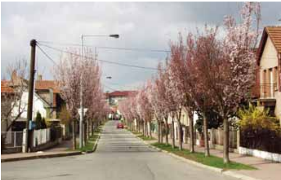
V ulici Běchorské byly v roce 1995 pokáceny staré zničené lípy. Každé jaro teď zdejší obyvatelé chodí v záplavě růžových vonících květů.

Výhodou komplexní rekonstrukce ulice je možnost vytvoření trvalého místa pro strom v souladu s ochrannými pásmy inženýrských sítí a s možností opakované výsadby při nutnosti výměny. Pokud se tedy ve světle těchto informací zamyslíme nad lípami v Komárovské, měli jsme dvě možnosti: První možnost byla ponechat stávající poškozené lípy se sníženou provozní bezpečností, které by v důsledku