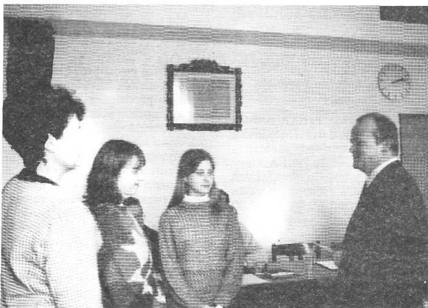
Děti ze Základní školy ve Stoliňské ulici uspořádaly sběr papíru, jehož výtěžek ve výši 2 500,- Kč předaly městské části Horní Počernice pro Nadaci Chvalského zámku.