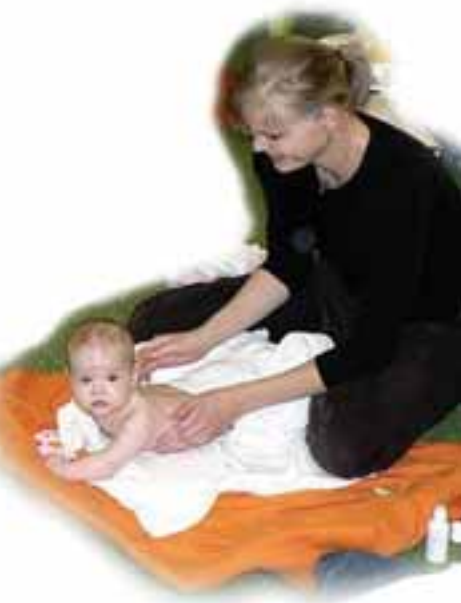
Masáže miminek upevňují vztah mezi matkou a dítětem.

Dvoudílný kurz masáže miminek. Naučte se masírovat své miminko a upevnit tak láskyplně váš vztah. S sebou nepromokavou podložku a olej (lze u nás zakoupit). Cena za dvoudílný kurz je 150 Kč, objednávejte se na tel.: 608512891.