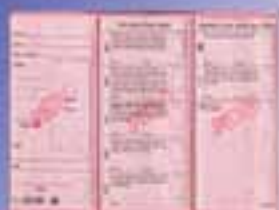
ŘP vydány v období: 1.7.1964-1986