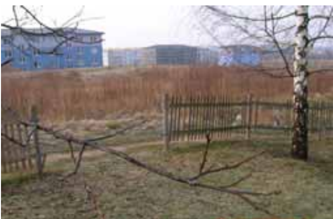
Na dětském hřišti v ulici Jizbické je stále ničeno oplocení.

Dále bude provedeno oplocení dvou pískovišť na sídlišti Ruprechtická a Pavlišovská včetně doplnění hracích prvků. Městská část věnuje rekonstrukcím a údržbě dětských hřišť velkou pozornost, aby měly naše děti co nejhezčí prostředí pro své hry.