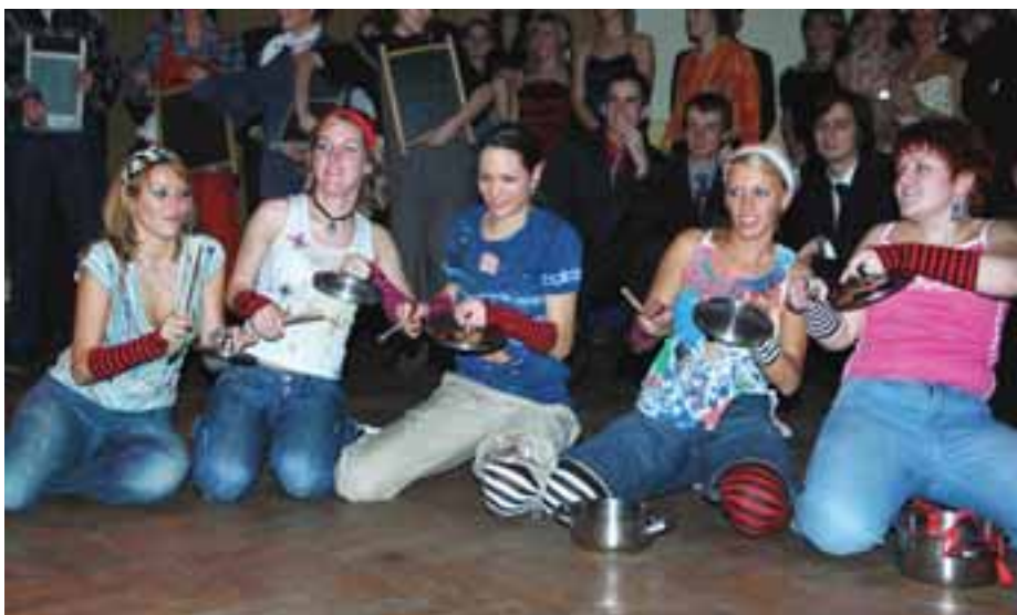
Velký úspěch zaznamenalo vystoupení s hrou na netradiční nástroje.

Okolo sedmé hodiny jsme dorazili do Národního domu na Smíchově, ze kterého přímo vyzařuje slavnostní atmosféra. Všichni zúčastnění se začali shromažďovat v hlavním sále, kde právě začínal první bod programu - slavnostní úvod a předtančení. Pak nastoupili primánci k svému slavnostnímu přijetí. Naši malí studenti byli dokonce tak nervózní, že se stala nečekaná nehoda a s ní se odhalil menší problém s úklidovou službou... Dívky z primy A a primy B si připravily krásné vystoupení, po kterém následovalo šerpování maturantů. Zájemci o tanec měli posléze příležitost se předvést na tanečním parketu. My ostatní, kterým se do tance moc nechtělo, jsme si popovídali s profesory, kteří na naší škole už neučí. V jedenáct hodin jsme se konečně dočkali vrcholného bodu večera - překva-