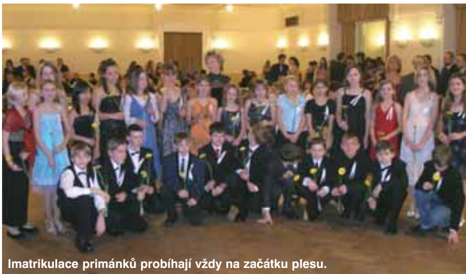
Imatrikulace primánek probíhají vždy na začátku plesu.