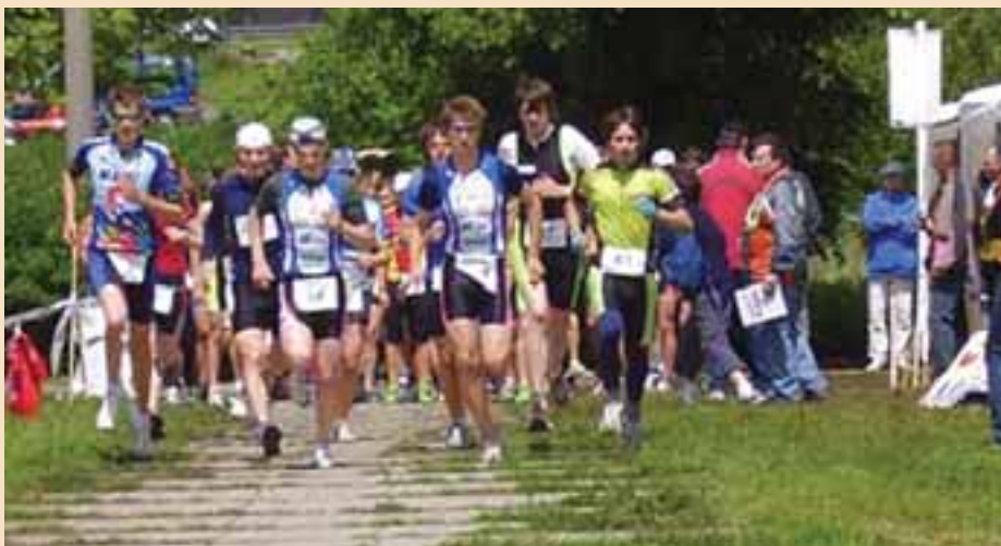
Počernický duatlon je zkouškou fyzické zdatnosti a vytrvalosti.

Pohárový triatlonový seriál a zejména statut mistrovství republiky zavazují pořada-