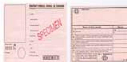
ŘP vydány v období: 1992-1993