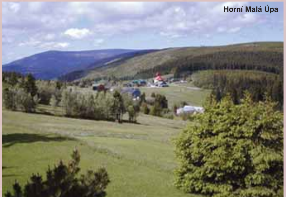
Horní Malá Úpa