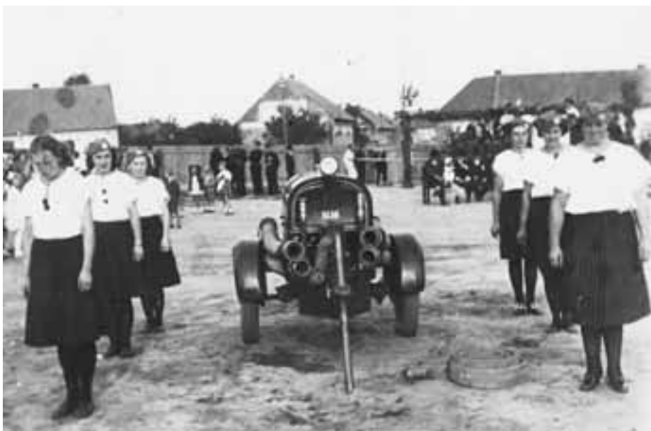
Hasičské cvičení na Chvalech v roce 1937 Hornopočernický zpravodaj

Vytváření prvních cílevědomě organizovaných skupin občanů pro boj s požárem začalo v první polovině 19. století, kdy po mnoha zkušenostech s velkými požáry bylo zřejmé, že už nestačí jen velká obětavost a množství lidí přispěchavších na pomoc. Bylo nutné záchranné práce řídit a organizovat vycvičené skupiny lidí vybavené technickými prostředky. V Praze byla za tímto účelem v roce 1821 tzv. stálá hasičská záloha, sestavená z tovaryšů kominických, pokrývačských, tesařských a dalších řemesel. Následný Pražský hasičský sbor z povolání, jak zněl jeho první název, byl založen 16. srpna 1853. Sbor měl třicet mužů, z nichž osm bylo určeno k obsluze stříkaček. Ostatní v mezidobí mezi požáry zametali ulice za nízkou mzdou 24 krejcarů na den. První sbor dobrovolných hasičů v českých zemích vznikl ve Velvarech v roce 1864.