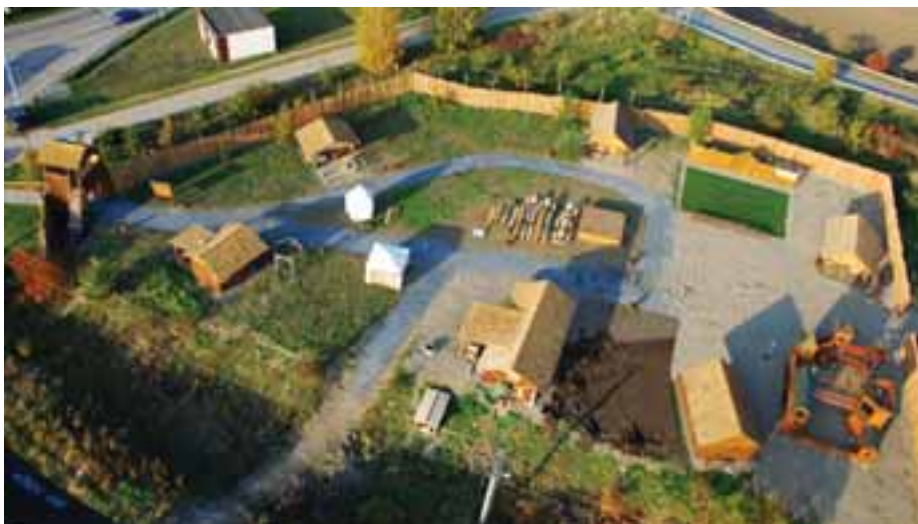
Letecký pohled na areál Hummer centrum