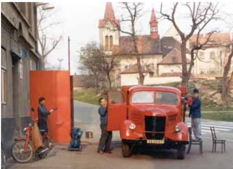
V sedmdesátých letech minulého století sídlili hasiči u chvalské školy.