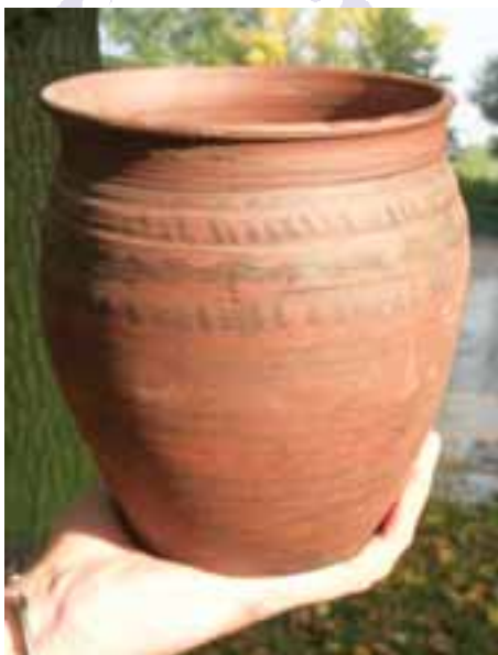
Nejstarší slovanské nádoby z 5. - 6. století byly v podstatě jednoduché bezúchové hrnce tzv. pražského typu.

Další zápis týkající se let 805 – 806 uvádí neúspěšné obléhání blíže neurčené pevnosti Canburg třemi francskými sbory, které bylo pokusem o podrobení českých Slovanů. Následující zápis uvádí, že roku 822 se ve Frankfurtu nad Mohanem konalo velké shromáždění zástupců jednotlivých zemí Francké říše, kterého se zúčastnili i přizvaní Češi a Moravané. To jsou ve stručnosti vyňaté údaje z písemností o ranném období Slovanů u nás.