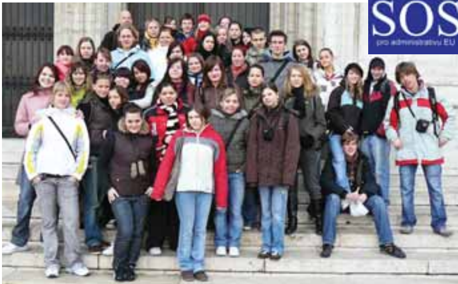
V belgickém Bruselu i francouzském Štrasburku mnozí z nás poznali, jak jsou na tom se znalostí angličtiny.

Bruselské Atomium, které představuje model molekuly železa zvětšený 165 miliardkrát, jsme si prohlédli jen zvenčí. Minievropa byla ještě uzavřená, ale pro nás alespoň o důvod víc se sem někdy vrátit. Zklamání nám bohatě vynahradila návštěva Evropského parlamentu, kde jsme měli možnost povídat si se sympatickou poslankyní Evropské lidové strany a Evropských demokratů MUDr. Zuzanou Roithovou, která ochotně odpovídala na naše zvědavé dotazy. Poté jsme se zatajeným dechem usedli do hlavního jednacího sálu, v němž se v současnosti schází 785 europoslanců. Jejich zasedací pořádek se řídí stranickou příslušností,