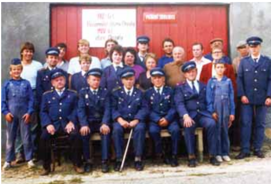
Rok 1988: chvalští hasiči slaví 110 let své existence.

Z dochovaných předpisů je možno uvést například požární řády města Prahy ze 14. století, řád pana Berky z Dubé z roku 1546 nebo požární nařízení královského horního města Kutné Hory z roku 1673. Nejstarší pražský požární řád například určoval, že vedení hasebnímu zásahu patří rychtáři, případně starším sousedům. Dále napomínal občany, „aby oni i jejich čeládka pečlivě s ohněm zacházeli, aby se neštěstí nestalo.“ V záznamech první kroniky Čertouz