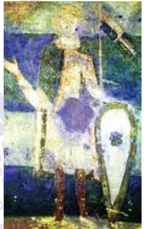
Vyobrazení prvního krále Slovanů Sámů na malbě ve znojenské rotundě (1019 - 1034).

O této časové etapě osídlování Slovy se dochoval také souvislejší písemný záznam zachycující část těchto dějin. Neví se sice, kdo je autorem, ale je jisté, že latinsky psaný spis označovaný jako Kronika mnicha Fredegara byl vytvořen ve druhé polovině 7. století v Burgundsku.