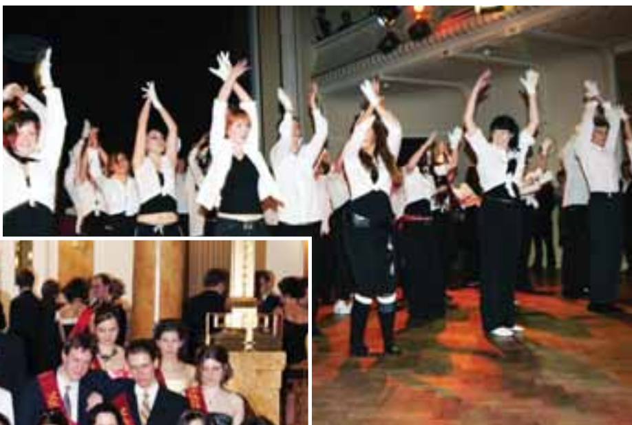
Jedenáctý maturitní ples gymnázia v Národním domě na Smíchově

Dne 18. února se konal námi všemi dlouho očekávaný 11. maturitní ples. Proběhl stejně jako v uplynulých letech v Národním domě na Smíchově. K tanci a poslechu hrál Big Band Miroslava Brože. Tradičně se na plese nekonalo pouze symbolické rozloučení s maturanty a jejich šerpování, ale i imatrikulace - tedy přivítání našich primánů.