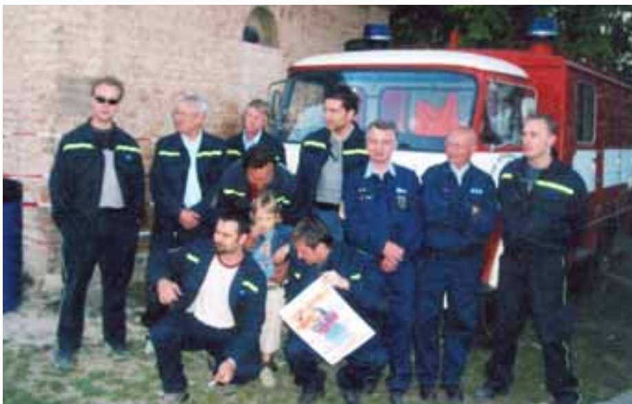
Chvalští hasiči dohlížejí každý rok na bezpečnost při Čarodějnicích, r. 2007.