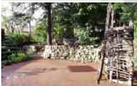
Program festivalu najdete na str. 16 Hornopočernický zpravodaj

Začíná 39. ročník festivalu ochotnických souborů Divadlo v přírodě