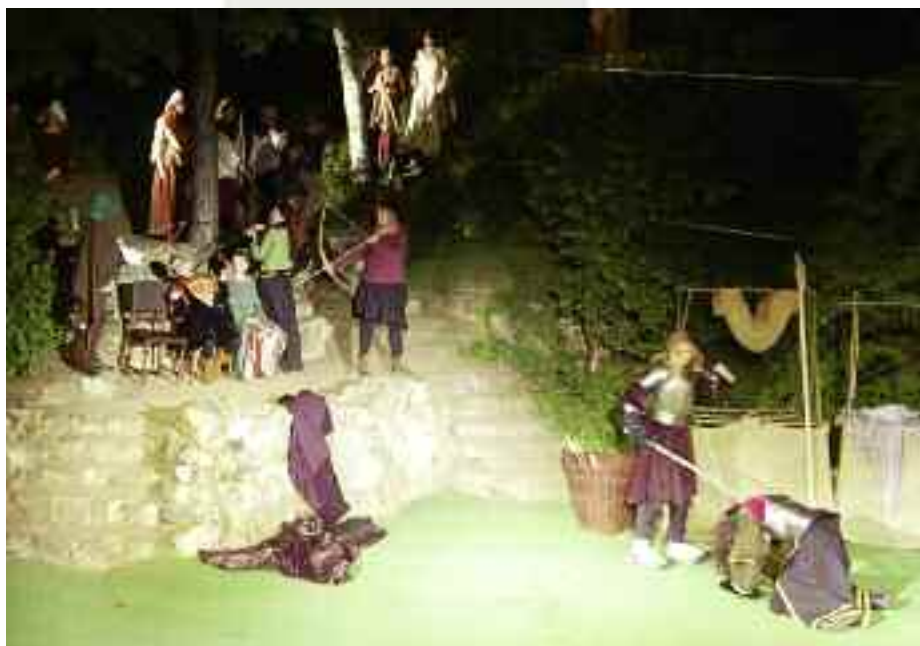
Představení Robin Hood na lošském festivalu Divadla v přírodě