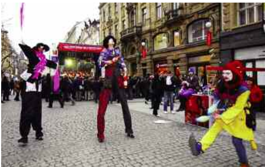
Na pěší zóně předváděli hudebníci a ekvilibristé vystoupení ve stylu karnevalu.

Eva Déduchová, vedoucí odboru školství a kultury