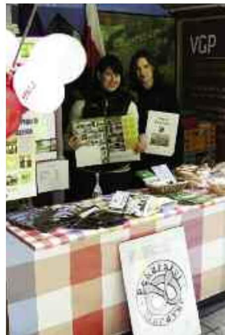
Stánek Horních Počernic