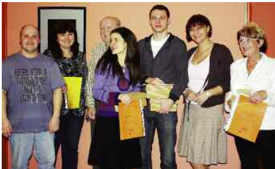
Počerničtí měli po vyhlášení výsledků POPADu 2009 důvod k radosti.