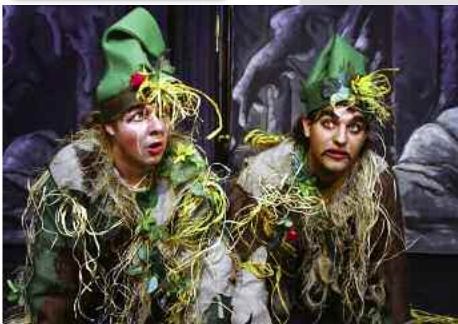
Představení pro děti: O dobru a zlu Hornopočernický zpravodaj