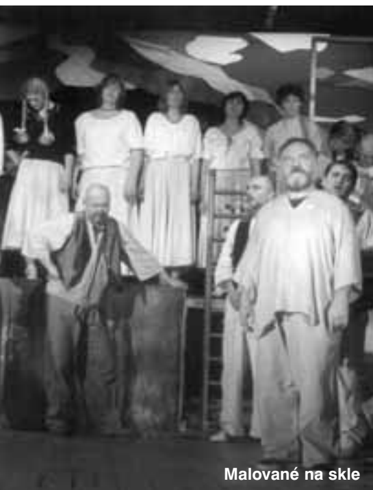
Malované na skle