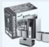
Subwoofer 5W 5.1 Value 1200W

Pentium 4 - 3.0GHz Prescott Windows XP Home cz MB GB 865PE 600FSB DDR 512MB / PC400 dual channel VGA 128MB GF4 FX-5000 128bit HDD 120GB / 7200rpm DVD vypalovačka DVDRW, FDD LAN 10/100, audio 5.1 (on MB) MidTower 350W optická myš, klávesnice, repro 19.990,- s DPH