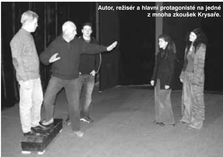
Autor, režisér a hlavní protagonisté na jedné z mnoha zkoušek Krysaře.