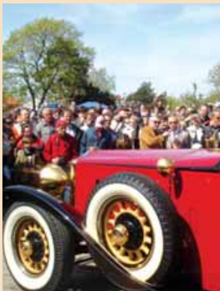
Odhalení nově zrenovovaného vozu Minerva AL z roku 1931

Několik desítek historických automobilů a motocyklů bylo vystaveno na 5. ročníku Veteran Rendez-vous v areálu Chvalské tvrze v sobotu 21. dubna. Od osmi hodin ráno se sjížděli majitelé veteránů, aby v plné kráse předvedli své miláčky, jejichž renovace si mnohdy vyžádá mnoho let usilovné práce.