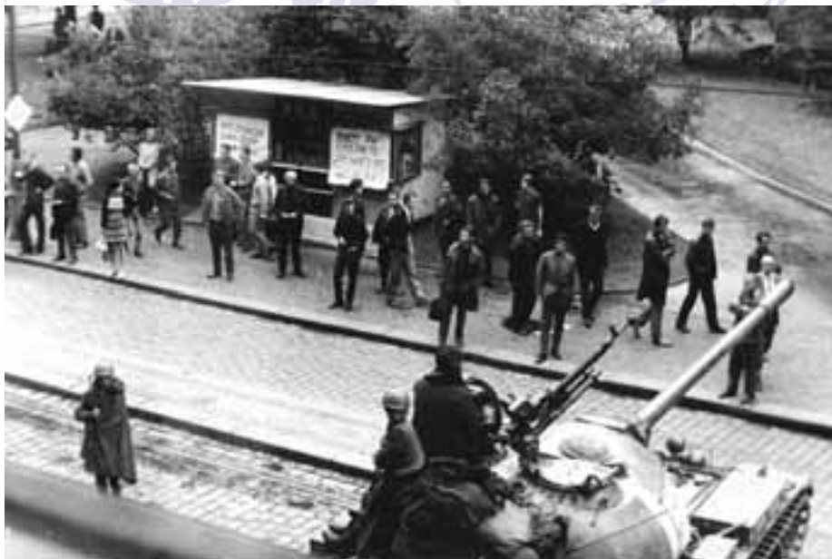
Události Pražského jara se promítly do každodenního života našich občanů.

V důsledku událostí byly odvolány přípra-