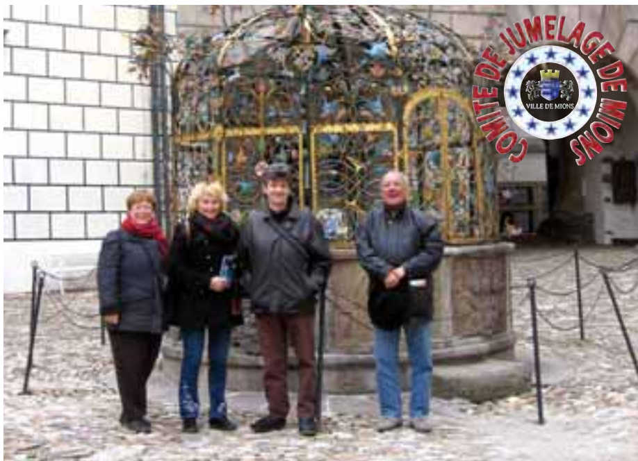
Francouzi obdivovali v jižních Čechách architektonické skvosty, mezi které patří zámek v Jindřichově Hradci.