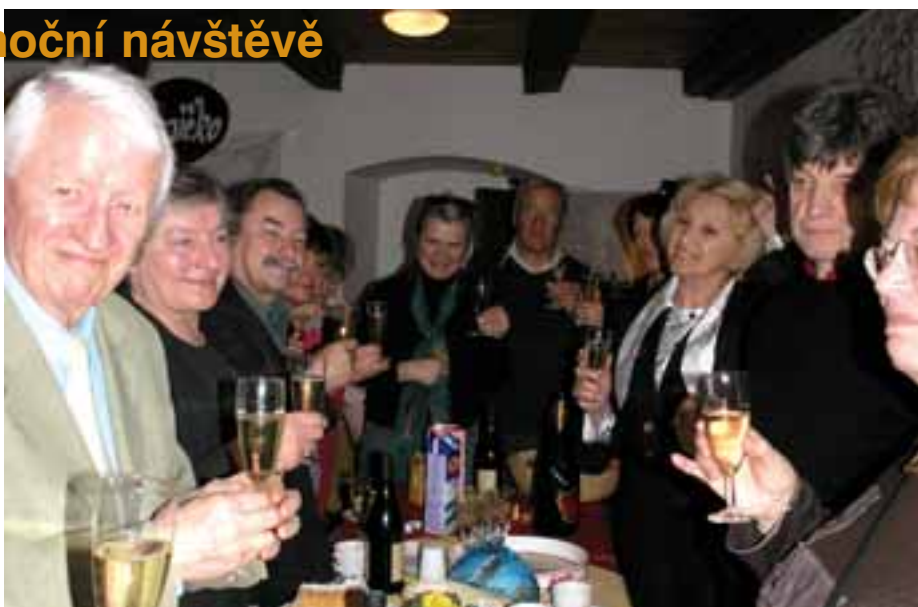
Při posezení se členy francouzského a českého výboru pro Jumelage u kávy a voňavých koláčů z DDM byly Velikonoce hlavním tématem debaty.