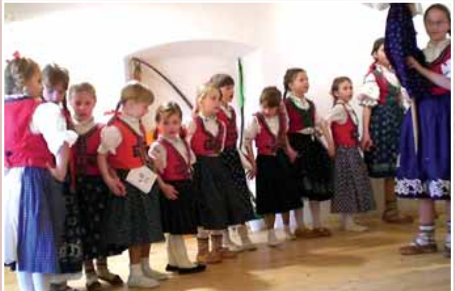
Velikonoční výstava na Chvalech: děti v lidových krojích, svižná hudba a především skvělé výkony všech účinkujících byly odměňovány bouřlivým potleskem.

Tento měsíc byl pro nás v Domě dětí a mládeže pěkně nabitý. Pojdte se s námi podívat na ty nejdůležitější akce. Jako první jsme připravovali tradiční velikonoční výstavu. I tentokrát si všichni mohli vyzkoušet svou šikovnost v tvůrčích dílničkách, a to jak děti, tak jejich rodiče. Předvádění řemesel jsme rozšířili o práci s kůží a řezbařinu. Celá akce se nesla v tradiční předvelikonočně jarní náladě, nad vším se vznášela vůně kávy a pečených housiček, o které byl mimořádný zájem. Kdo nechtěl sám něco vytvořit, mohl si zakoupit nějaký krásný dárek z pestré nabídky velikonoční keramiky.