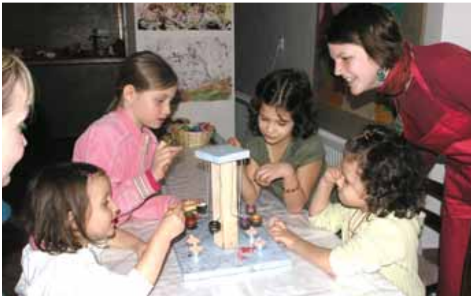
S velkým zájmem se u dětí setkalo zdobení velikonočních kraslic voskem.

K vidění i ke koupi bylo velké množství výrobků, v tvůrčích dílnách si děti s pomocí lektorů mohly ozdobit nebo odrátovat velikonoční kraslice a drobnou keramiku, vytvořit dekoraci, vidět ukázky velikonočních zvyků, řezbářského řemesla nebo pečení z nekynutého těsta. S velkým zájmem návštěvníků se setkala také vystoupení dětských tanečních a hudebních souborů a divadelní představení pro děti - pohádka Hanička a Honzík slaví Velikonoce.