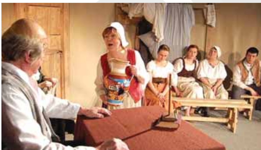
DS Svatopluk Benešov: Rozbitý džbán