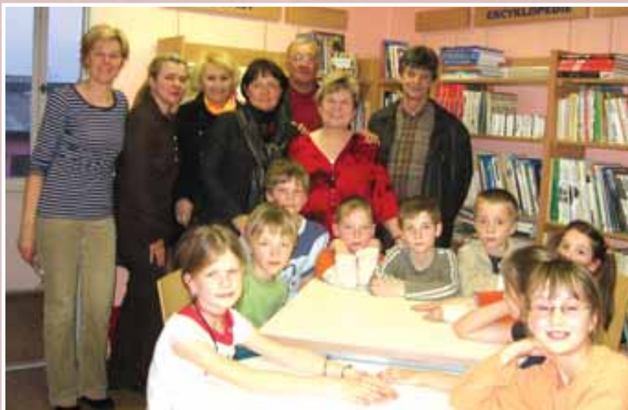
Překvapením večera v knihovně byla návštěva francouzské delegace z Mions.