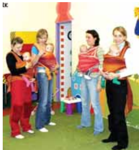
Kurz vázání miminek do šátku květen 2007