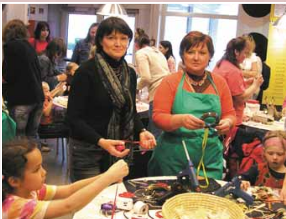
DDM na akci Škudlíkovy dílničky pro šikovné ručičky v obchodním domě IKEA.