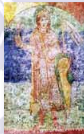
První český král Vratislav II.