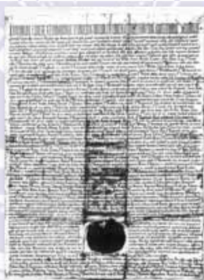
V zakládací listině Vyšehradské kapituly je poprvé písemně uveden název původní vsi Chvaly.

Z dalších dochovaných písemných záznamů lze sledovat, jak se ve vlastnictví částí nebo celých vsí střídaly méně či více známé osobnosti z pražských a českých