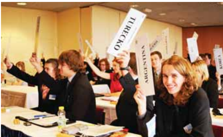
Vojta alias Argentina hlasuje. Hornopočernický zpravodaj

Od soboty do pondělí probíhala v kongresovém centru zmíněná jednání, která se neobešla bez tradiční simulace světové krize. Letos jsme si „hráli“ na rozpad Gruzie. OSN ale také řešila další body své skutečné agendy – odstraňování následků přírodních katastrof, přijetí Ruska do WTO, energetickou výživu lidstva a další problémy, které mezinárodní společenství sužují. Výsledkem každého projednaného bodu bylo přijetí rezoluce, která má pomoci k jeho řešení. Zní to velice vážně, ale věřte, že jsme si při tom užili i spoustu legrace.