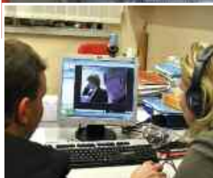
Internetové spojení mezi dětmi z chvalské školy a mediátekou ve francouzském Mions se podařilo.