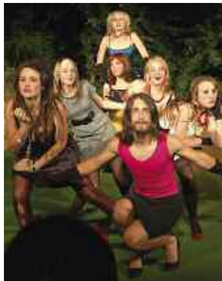
Představení Čarodějnice, foto z 40. ročníku Divadla v přírodě