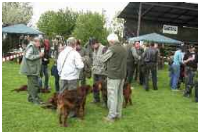
Pořádání veřejných vystoupení zvířat povoluje dle zákona obec. /ilustrační foto/