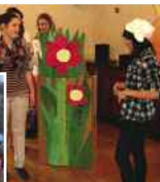
Studenti gymnázia zahráli dětem čtyři pohádky. Ve Chvalském lomu se pekly buřty, ale večer tam trochu strašilo.

žáci naší školy. Večer se školní družiny proměnily v ležení unavených poutníků. Nastala část Noci s Andersenem, která měla pro nás pedagogy velké kouzlo. Čtení se bravurně ujaly naše žákyně, ale pro znavené děti se pohádkové vyprávění brzy stalo cestou do říše snů. Po ranním probuzení se ještě diskutovalo o pohádkách a pravosti strašidel, jinde se polštáři bojovalo o princeznu. Byla to krásná akce. Nezbyvá než poděkovat všem, kteří se na její přípravě podíleli, ať z knihovny, naší školy, Chvalského zámku, skautského oddílu nebo radnice.