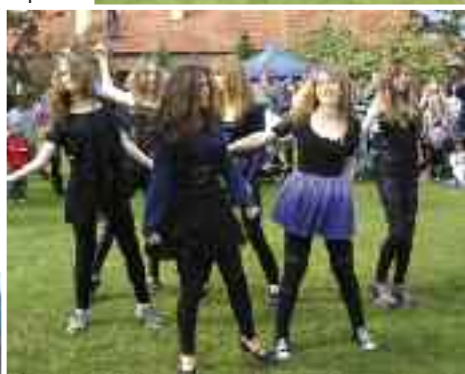
Taneční vystoupení dětí z DDM