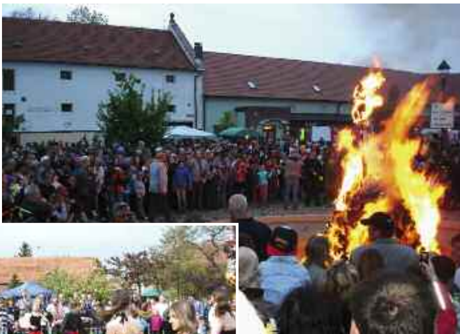
Letošní 22. ročník měl bohatý program, v němž nechyběla tradiční soutěž o nejkrásnější čarodějnicí.