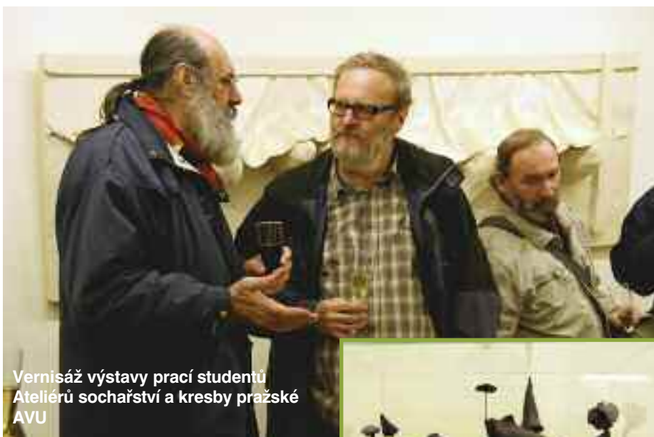
Vernisáž výstavy prací studentů Ateliérů sochařství a kresby pražské AVU