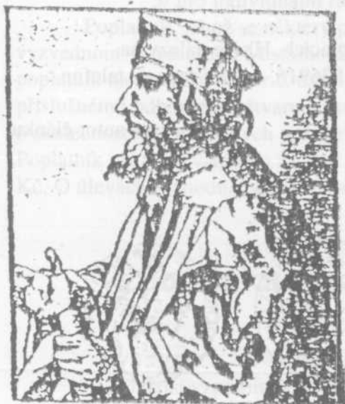
mistr Jan Hus

Bez nadsázky je možno říci, že pro postoj k našim národním dějinám je pro nás Čechy určující vztah k Mistru Janu Husovi.