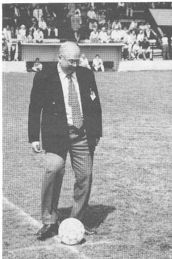
Slavnostní výkop přátelského fotbalového utkání družstev Horních Počernic a výběru kandidátů ODS provedl ministr zahraničí Josef Zieleniec.