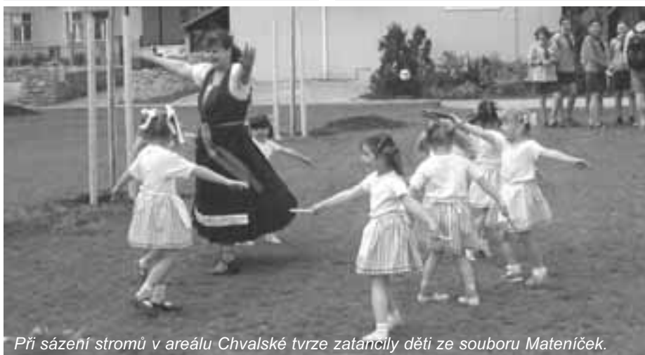
Při sázení stromů v areálu Chvalského zámku zatancily děti ze souboru Mateníček.