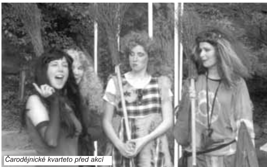
Čarodějnické kvarteto před akcí

Místní divadelní soubor Mladí a neškodní se specializuje na pohádky. Ta letošní byla Čarodějnická a všichni se při ní náležitě vyřádili, zejména pyrotechnik.