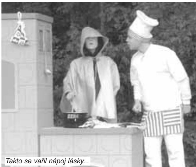
Takto se vařil nápoj lásky...

Více než milým překvapením bylo vystoupení divadelního souboru D'Genere z Letňan a jejich „semaforská“ Kytice potěšila nejen pamětníky. Představení bylo vtipné, pěvecké a muzikantské výkony velmi dobré. Při věku všech protagonistů mezi 15 a 19 lety nezbývá než doufat, že jim nadšení a elán vydrží. Těšíme se, čím nás překvapí za rok.