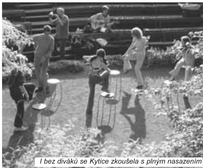
I bez diváků se Kytice zkušela s plným nasazením