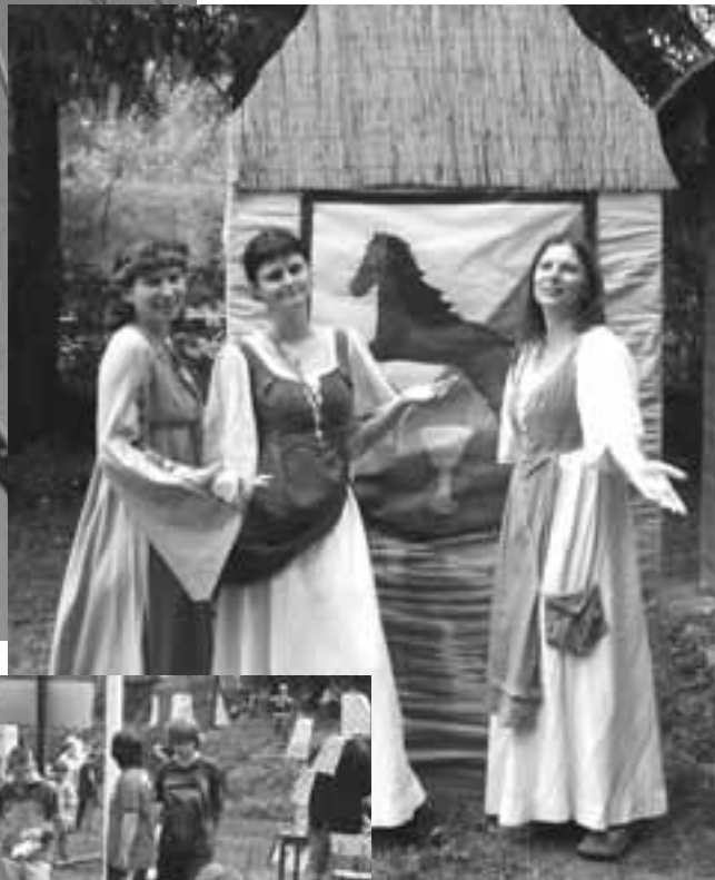
Nahoře: Lektorky z DDM Vlevo: Hráči šachů