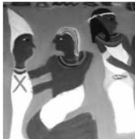
Ukázka práce našich žáků

ještě dlouhý čas. Na stromě střídavě usedají motýli, rozkvétají květiny, houpají se kraslice nebo krajkové vločky. Dnes byste na něm našli i bílé ruce našich žáků a pod ním jejich záhadné nohy. Na stěně za ním se vlíná jako drátěná obrovitá krajka stříbrošedé pletivo, které slouží jako podklad pro další výtvarné práce. V témže patře na výstavních "plotech" visí barevné hlavolamy a na paravanech grafické práce, jaké byste možná hledali spíše ve výtvarných galeriích. Při pohledu vzhůru vás lehounce zamrazí, neboť nad vámi po zdech posedávají veliké včely, mouchy a čmeláci. Dětské práce pod skly na zdech svědčí o neuvěřitelné zručnosti a trpělivosti našich žáků. Nejužasnější na všech pracích je to, že jsou tvořeny téměř "za babku", z velmi levných materiálů. A to ještě nevíte, co máme vytvořeno ve druhém patře.