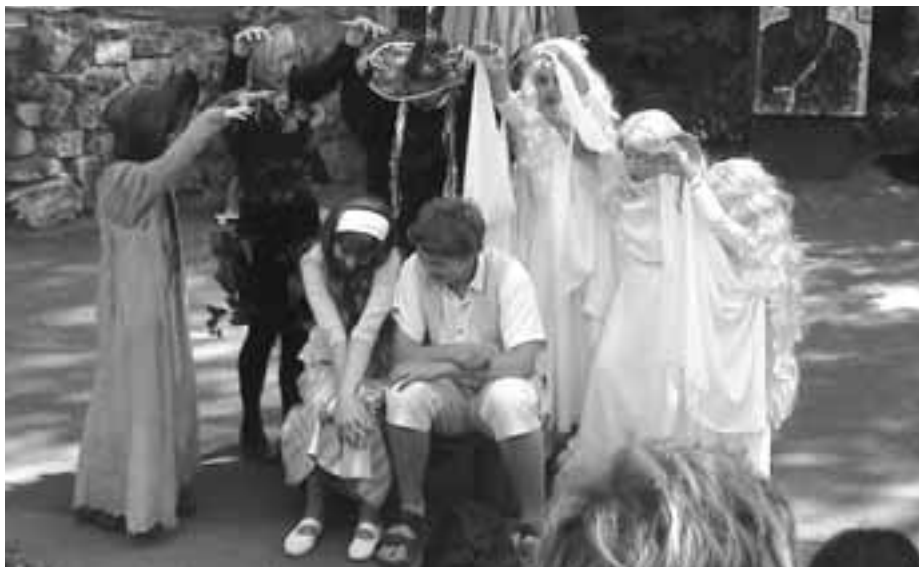
O Vendulce a Vitouškovi, DS Počerničci