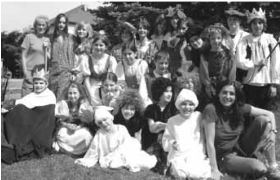
Představení DS Počerničci: Tři princezny na vdávání