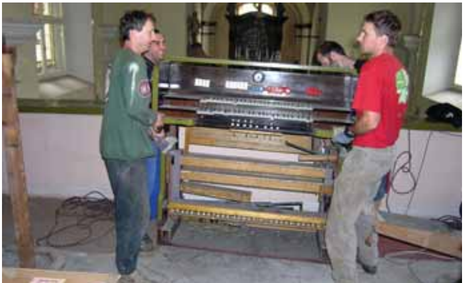
Na odstranění starého nástroje se podíleli místní skauti.