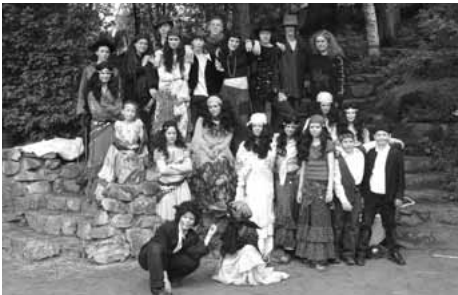
O cikánské lásce aneb hádalo se nebe s peklem