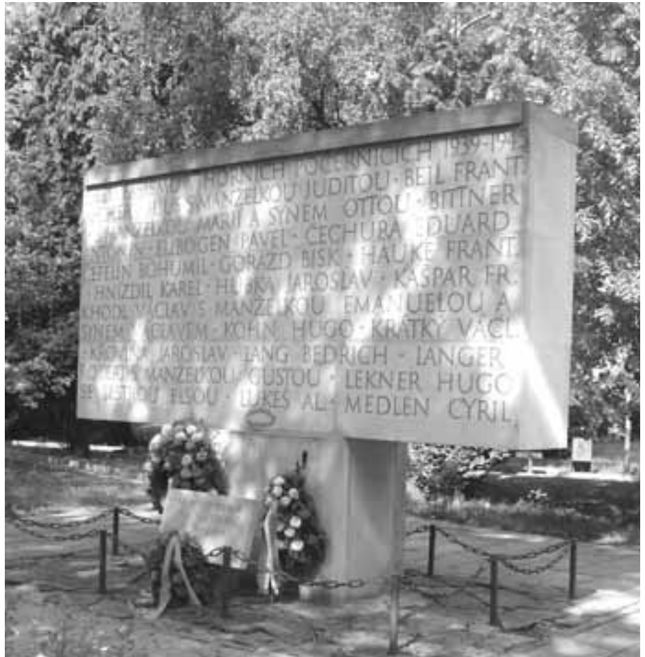
Druhá světová válka připravila o život 78 občanů Horních Počernic.