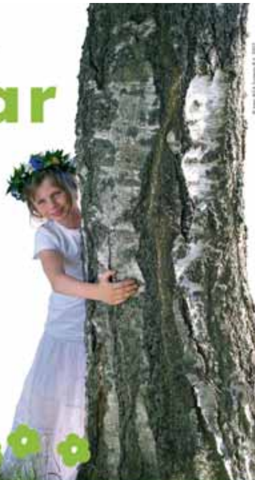
© Ikea IKEA Sweden 6 6 2007

IKEA Praha • Centrum Černý Most, Chlumecká 10, Praha 9-Černý Most IKEA Praha • AVION Shopping Park, Skandinávská 1, Praha 5-Zličín