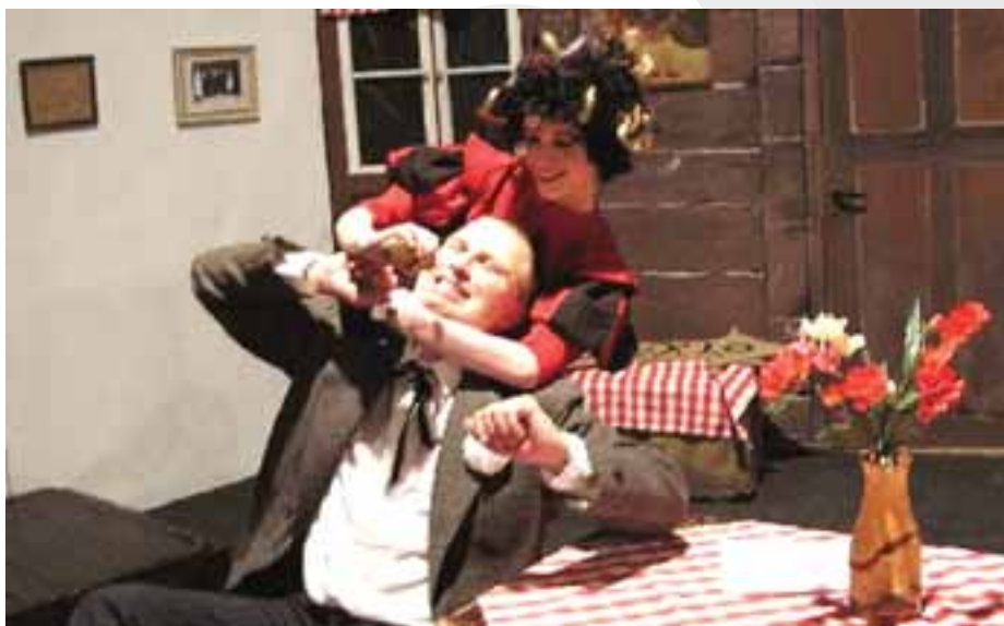
Hálkovo městské divadlo Nymburk: ŽENICH PRO ČERTICI