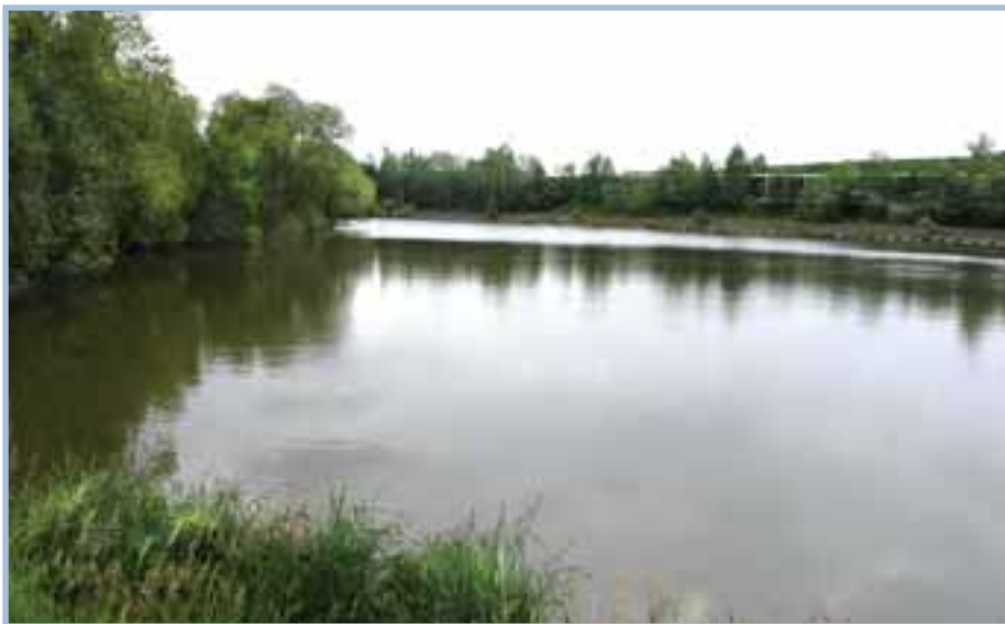
Původně biologický rybník Xaverovský I. se nyní využívá k odchovu ryb.

V České republice existuje kolem dvaceti tisíc malých vodních nádrží, převážně historických rybníků, ale i menších vodních ploch. Jejich význam nespočívá pouze v biologické hodnotě, ale také v řadě dalších funkcí, mezi které patří produkce ryb,