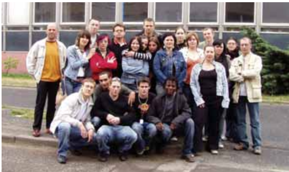
Studenti z lycea v St. Quentinu a jejich profesori před SOŠ pro administrativu EU