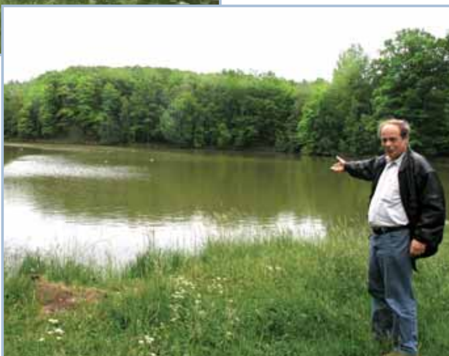
Retenční nádrž na konci ulice Na Svěcence byla obcí a místní organizací rybářů vybudována v roce 1967 a je využívána jako chovný rybník.