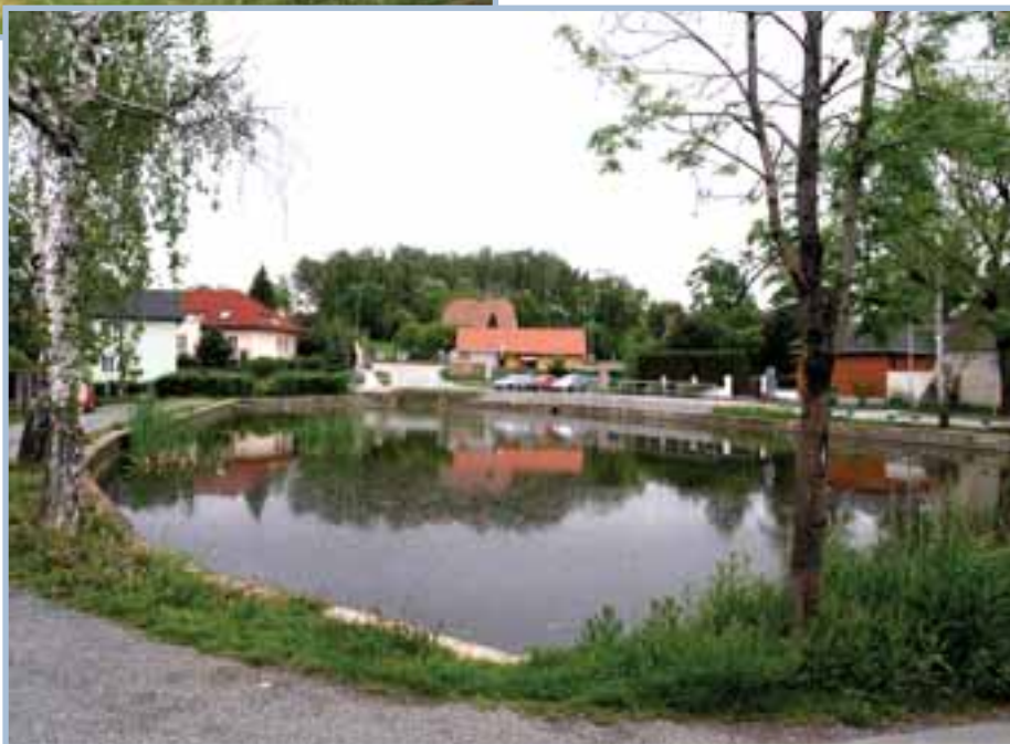
První zmínka o svépravičském Staráku pochází z druhé poloviny 19. století.