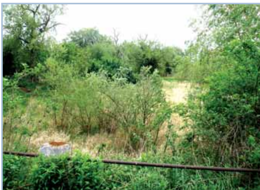
Stavba dálnice udělala z Palečku "nebeský" rybník.