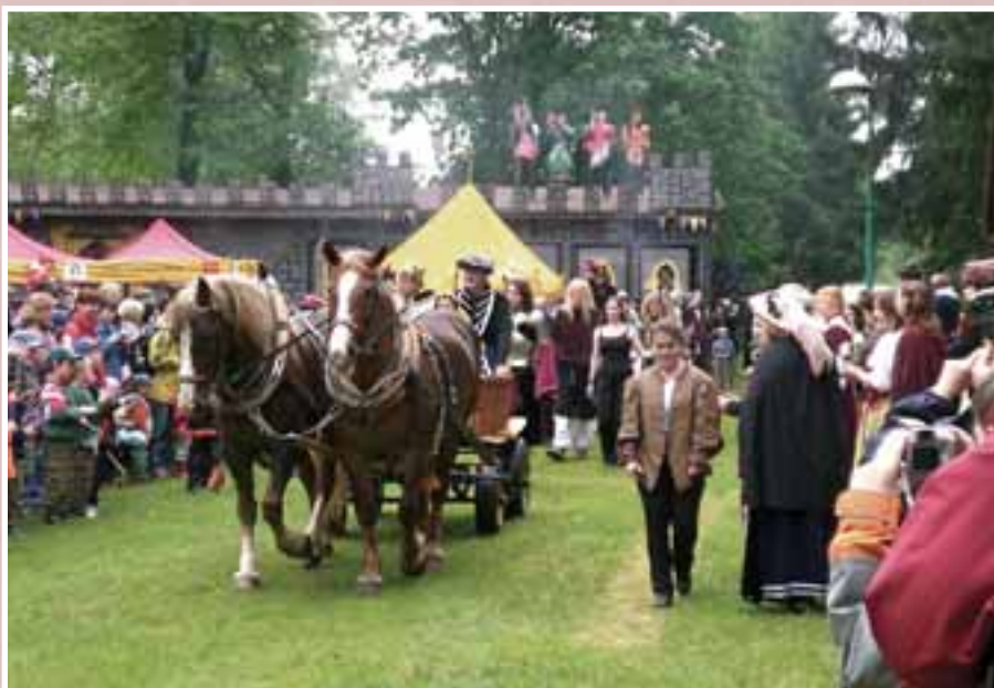
Letošní výlet dětí z pražských DDM na Lhotku u Mělníka se obzvlášť vydařil.

Pomalu ale jistě se naplňují naše letní tábory. Pokud máte zájem, opravdu