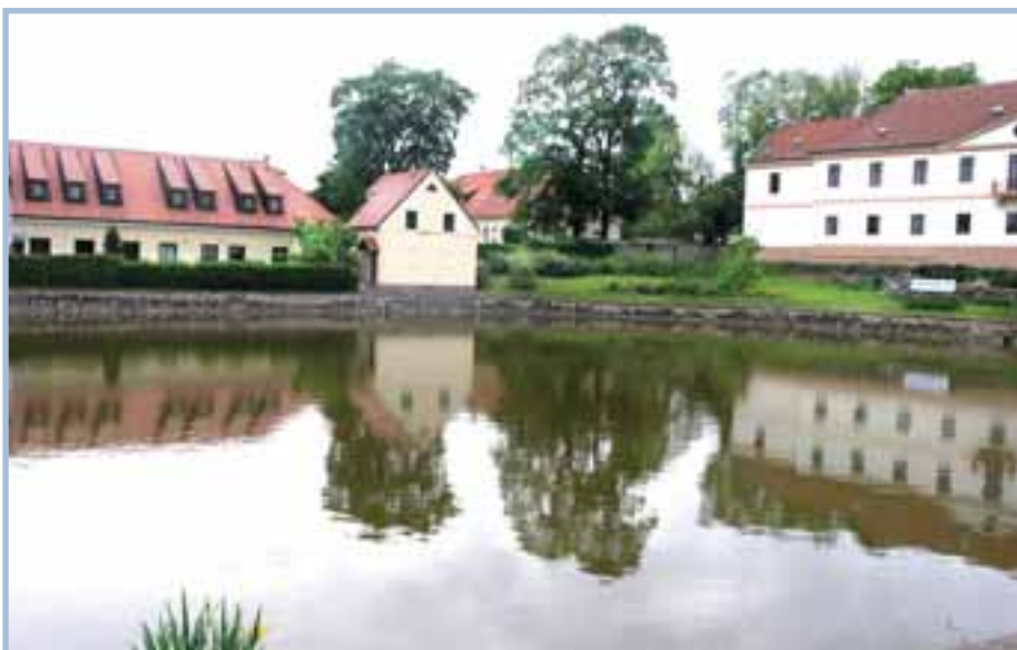
Rybník na Křovínově náměstí je v záznamu z roku 1602 označován jako Jezero počernické.

Probíhají také přípravy zpracování projektů rozvoje dalších cyklistických stezek