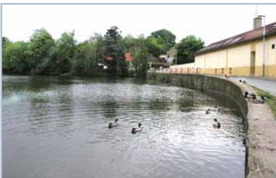
Chvalský rybník při ulici Stoliňské je písemně zmiňován už v 18. století v souvislosti s provozem mlýna.