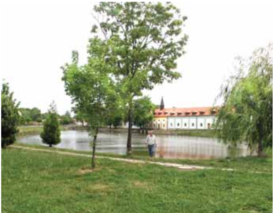
Podpsychrovský rybník, jehož historie sahá do 16. století, je nejstarší v katastru naší obce a v kronikách označován jako Jezero koleje císaře Karla IV.