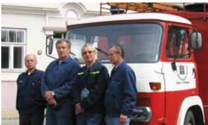
Hornopočerničtí hasiči simulovali v ZŠ Stoliňská požární poplach, aby si děti i učitelé vyzkoušeli, co znamená náhlá evakuace.

Městská část Praha 20 Horní Počernice zve všechny zájemce na veřejné setkání, konané v úterý 10.6. 2008 od 15.00 hod. v prostorách Chvalského zámku. Setkání je zaměřeno na analýzu sociálních služeb poskytovaných na území Horních Počernic. Cílem je zjistit spokojenost se službami a představu o jejich budoucím rozvoji. Ing. Monika Brzkovská