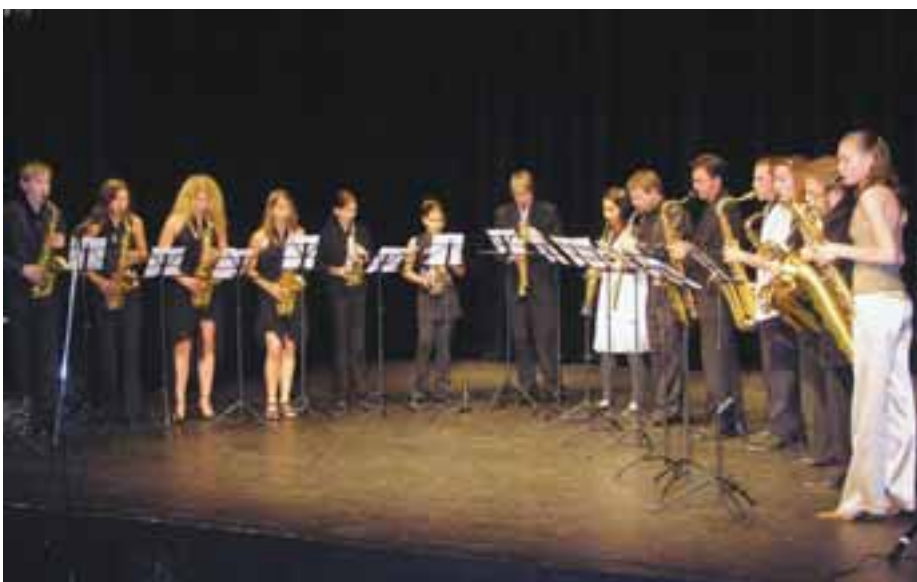
Saxofonový orchestr vystoupí v Divadle Horní Počernice v úterý 10. června 2008 od 18 hodin.