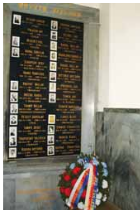
Pamětní deska obětem války v kostele sv. Ludmily na Chvalech.