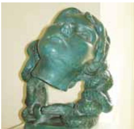
Medúza, 2006 /pálená hlína/ Sochař Radovan Pauch /1967/ žije a tvoří v Horních Počernicích od začátku 90. let minulého století.

/Pozvánku a program koncertu najdete na straně 12/.