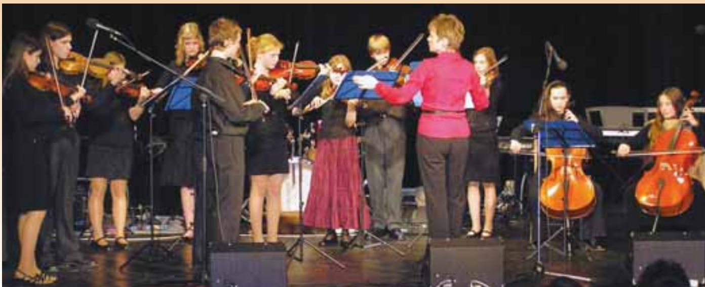
Foto dole: Smyčcový soubor ZUŠ Horní Počernice vystoupí při III. ročníku festivalu studentských orchestrů v pátek 6. 6. v 17 hodin v divadle.

Na všechny koncerty vás za naše žáky a pedagogy srdečně zve Libor Žíka, ředitel ZUŠ