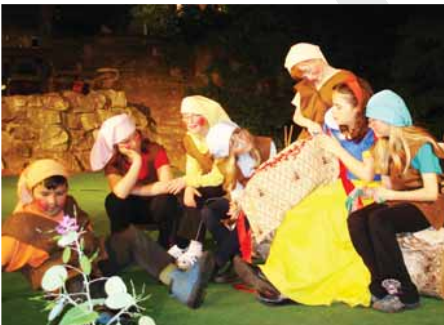
Pohádka Sněhurka a sedm trpaslíků v podání DS Počerníci a v režii Zdeny Víznerové a Olga Šmejkalové měla premiéru 16. května 2008.