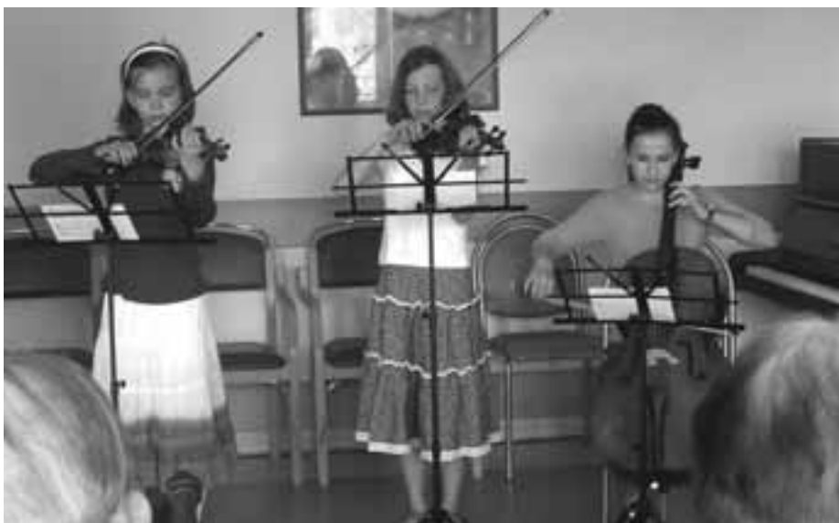
Pražské jaro v Bethesdě: děti ze ZUŠ přinesly do domu seniorů hudbu a radost

Repertoár byl velice svěží, klienti Bethesdy se nechali slyšet, že je to „účinná transfuze“. Můj osobní zážitek - kromě toho hudebního - byl i v znovuobjevení starého známého úsloví „Blahoslavenější