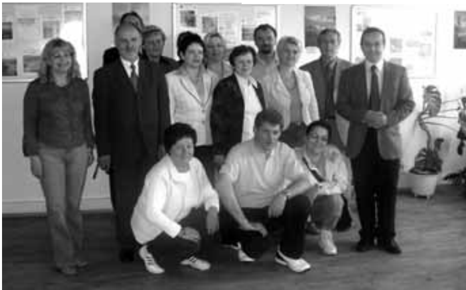
Delegace z polského Brzesku při návštěvě SOŠ pro administrativu EU Hornopočernický zpravodaj