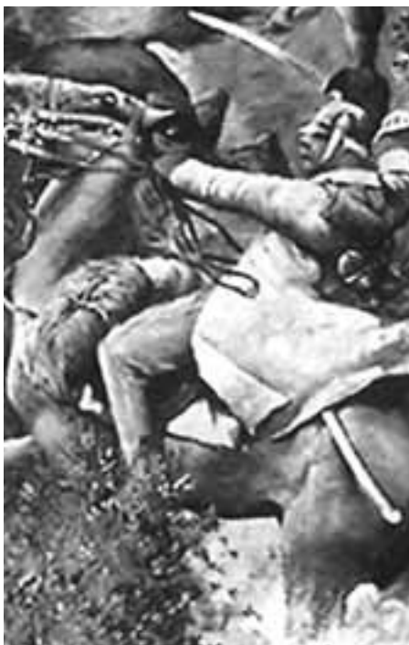
V Prusko-rakouské válce krvácely tisíce českých vojáků.

Tyto události se podstatně dotkly i našich obcí. Po vyhrané bitvě táhla vítězná pruská armáda na Prahu, a i když se Rakousko pokusilo znovu zformovat u Olomouce armádu a místní srážky trvaly až do poloviny července, došly pruské jednotky na naše území už 7. července v síle 6 tisíc mužů a chystaly se obsadit Prahu.