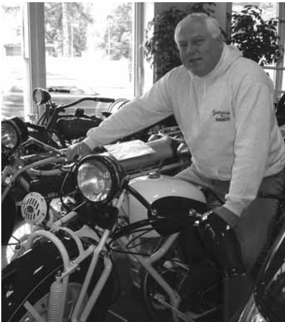
Na nejdelším motocyklu na světě značky Čechie-Böhmerland lze těžko nalézt něco zcela běžného.

"Myslím, že tak deset procent, ale možná i méně a v různém stavu kompletnosti. Mnohdy jde jen o torza strojů a součástky, kompletních motocyklů je u nás v současné době asi pětasedmdesát. V 70. letech