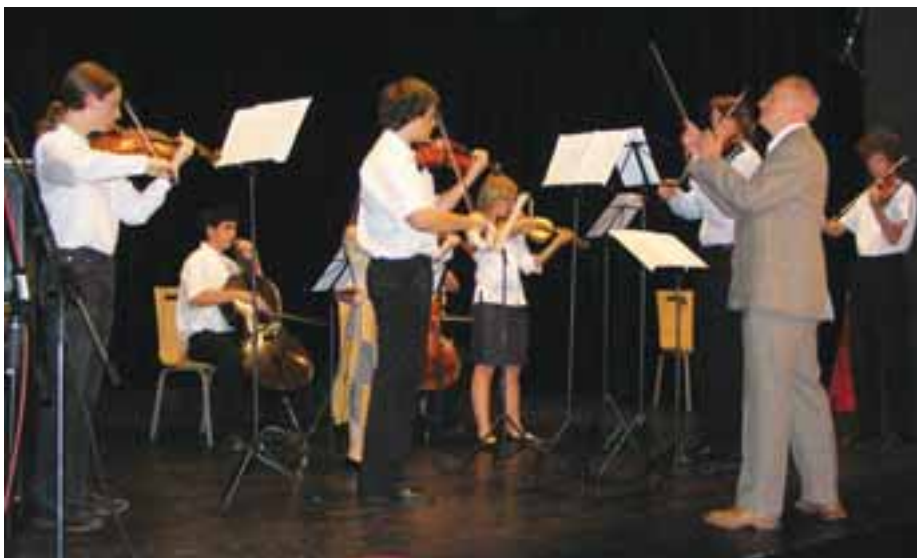
Komorní smyčcový orchestr ZUŠ Učňovská, Praha 9

„Naše škola má soubory nejrůznějšího nástrojového obsazení, mezi tradiční seskupení patří kromě jmenovaných orchestrů také saxofonové nebo klarinetové kvarteto nebo flétnový soubor. Na festivaly jsme začali jezdit právě díky Liboru Zíkově. Taková pravidelná setkání jsou pro hráče velkou motivací a příležitostí k výměně a získání cenných zkušeností. Když děti veřejně nevystupují, nemají možnost srovnání, proto jsou festivaly ideální příležitostí ukázat druhým, co umějí, a zároveň se něco nového naučí. Horní Počernice jsou pro taková setkání ideální, prezentují se zde pražské i mimopražské orchestry a úroveň zdejšího festivalu stále vzrůstá. Navíc akce morálně i finančně podporuje vedení vaší