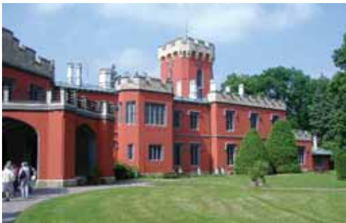
Zámek Hrádek u Nechanic ve stylu windsdorské gotiky

V květnu jsme se vydali do světa za kulturou. Navštívili jsme zámek Hrádek u Nechanic. Zámek ve stylu windsdorské gotiky sloužil jako reprezentační sídlo šlechtického rodu Harrachů. V zámku jsme si prohlédli jedinečný soubor nábytku,