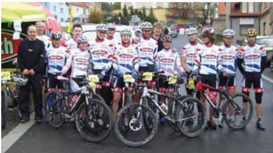
Pozice týmu je po posílení jednoznačně lepší než tomu bylo loni.

Také ostatní členové týmu bojují ve svých kategoriích, ale zatím se jim nepodařilo dosáhnout na stupně vítězů. Mají ale výsledky, které je řadí do popředí závodního pole, a odvádí tak pro tým dobrou práci.