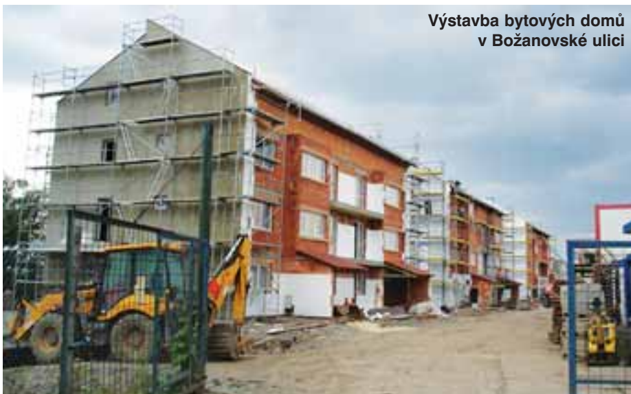
Výstavba bytových domů v Božanovské ulici

možnosti dalšího rozvoje zejména bytové výstavby. Kdybychom nyní zastavěli všechny plochy k tomu určené, došlo by k nárůstu počtu obyvatel více než o 16 tisíc a Horní Počernice by měly oproti