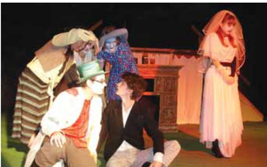
K nejlepším vystoupením hostů patřilo představení Mrtvá nevěsta divadelního souboru Mršta Pršta z Kouřimi.

sky tak náročné akce je snaha udržet mnohaletou tradici a podpořit u nás spolkovou činnost. Oblíbená divadelní přeh-