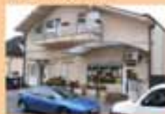
pekárna – ul: Běchorská 2012 H.Počernice tel 281921628