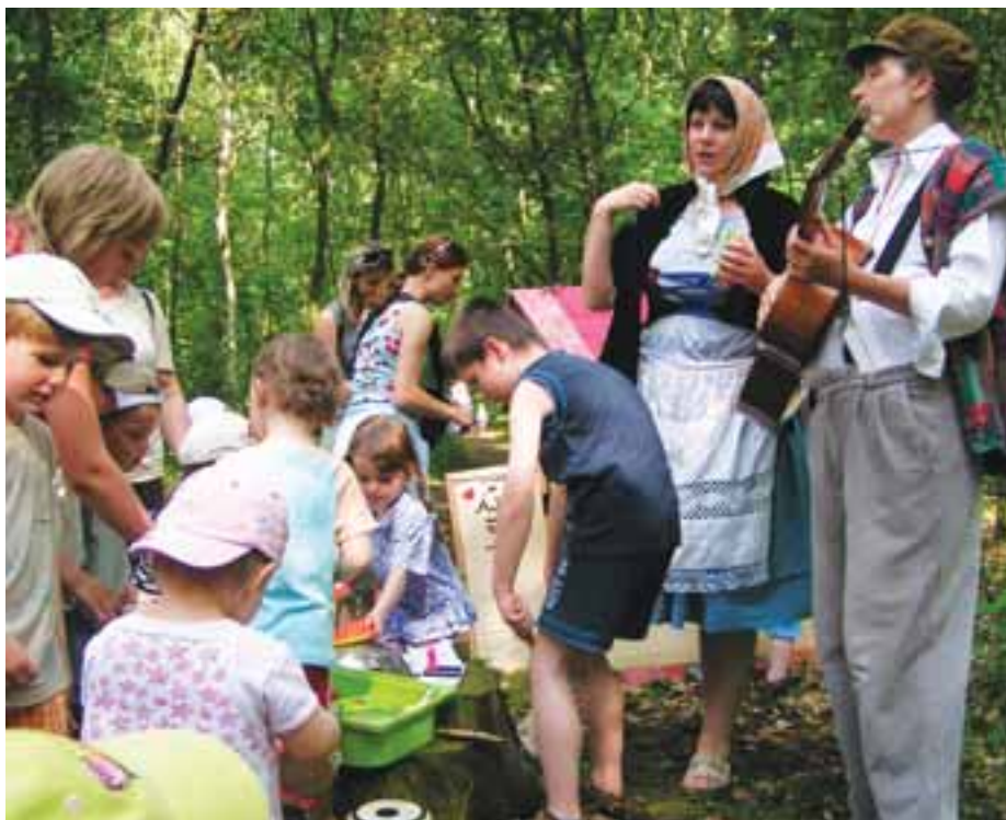
Závěr školního roku zpestřil dětem Pohádkový les v lese u Koupaliště.

Po dobu školních prázdnin je MUM uzavřeno. Těšíme se na Vás opět v září.