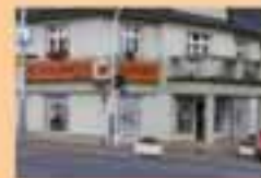
prodejna – ul: Jivanská 635 H.Počernice