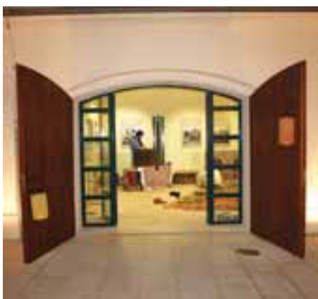
V rámci Muzejní noci přijela na Chvalský zámek i Potulná čajovna Čajchan