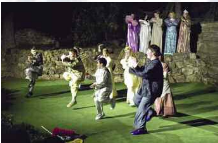
DS Počerničci: O třech kouzelných závojích Hornopočernický zpravodaj