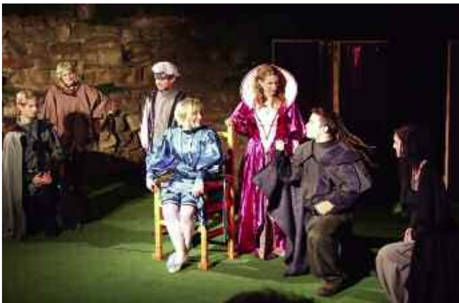
DS Výtečníci: Princ a chudás, pohádkový příběh z doby vlády Jindřicha VIII.