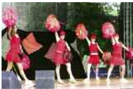
Děvčata z tanečních kroužků našeho DDM na Bambiriádě