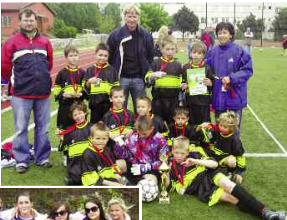
Dne 29.4.2009 zabojovali naši nejmladší fotbalisté z 1. – 3. ročníku v okresním finále McDonald's Cupu a po dvou výhrách a jedné remíze obsadili 2. místo.