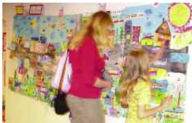
Výstava soutěžních prací v prostorách špejcharu