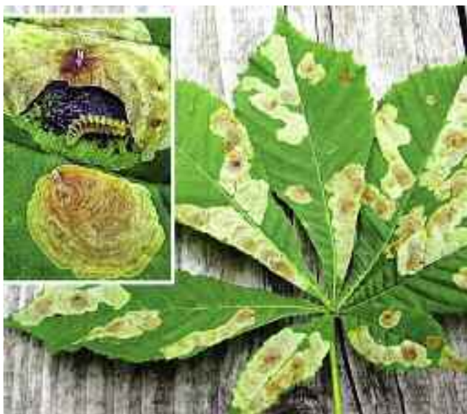
List kaštanu napadený klíněnkou jírovcovou Hornopočernický zpravodaj