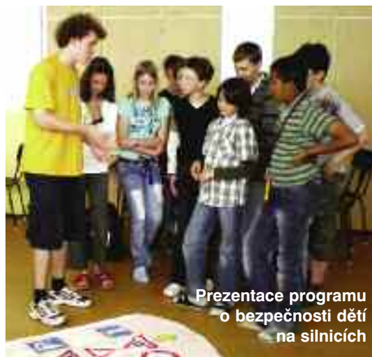
Prezentace programu o bezpečnosti dětí na silnicích