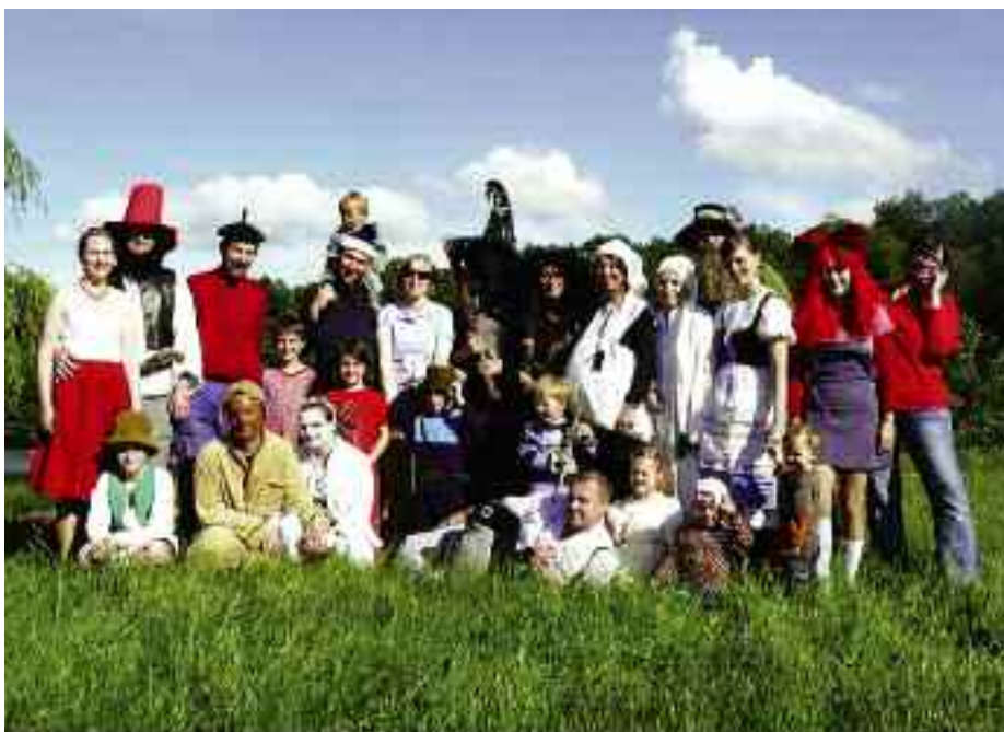
Hlavními protagonisty Pohádkového lesa byly letos postavy z večerníčků

jsou neziskové organizace nuceny spíše šetřit, nás opravdu potěšilo, že můžeme tuto pomoc realizovat. Poslední velký dík patří našim sponzorům, kteří se podíleli věcnými i finančními dary. V prvé řadě bychom chtěli poděkovat Úřadu městské části Praha 20, který zapůjčil stánky do prostoru startu a cíle, a ochotným pracovníkům místního hospodářství, kteří je stavěli. Díky Pekařství Moravec vyráželi letos soutěžící k plnění úkolů s dostatečnou zásobou cukru v krvi. Ostatní dary pokryly odměny pro startu-