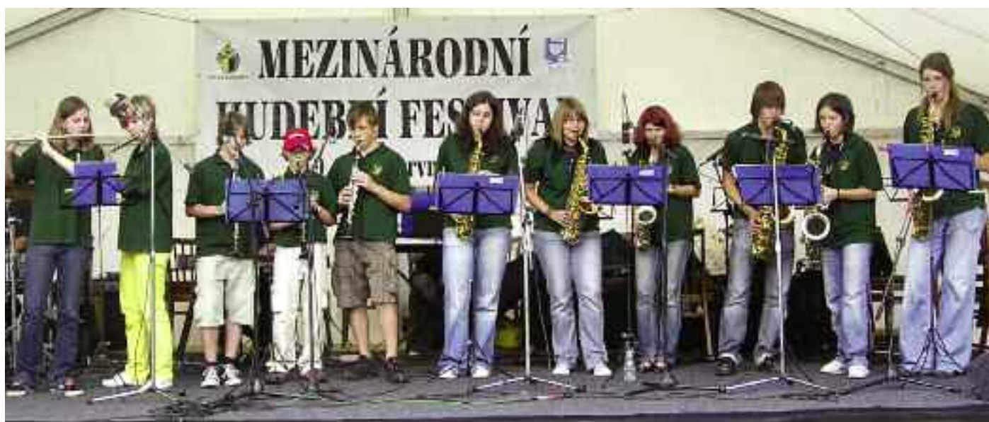
Junior Band na mezinárodním hudebním festivalu v České Kamenici Hornopočernický zpravodaj

úspěchu pak Junior Band dosáhl na 10. mezinárodním hudebním festivalu v České Kamenici, kde získal 3. místo. V kategorii žáků do 18 let se ho zúčastnilo devět orchestrů z Čech, Německa