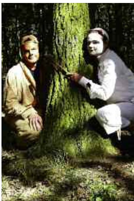
Pejskovi a Kočičce pomáhaly děti při pečení dortu.

Po vyzvednutí startovací karty se každý účastník mohl posilnit koblihou a pak se radostně vydat k plnění úkolů. Letos byla stanoviště tematicky sjednocená a inspirovaná pohádkami z televizních večerníčků. A tak startující pomáhali zalévat květiny Makové panence, zkoušeli se orientovat v ročních obdobích u Křemílka a Vochoomůrky, svou dovednost prokazovali u Pata a Mata nebo skákali v pytlích u Macha a Šebestové. Hod na cíl hlídal Rumcajs s Mankou a Cipískem, Pejsek s Kočičkou potřebovali pomoc při pečení dortu. U čarodějnic děti vykonávaly zkoušku