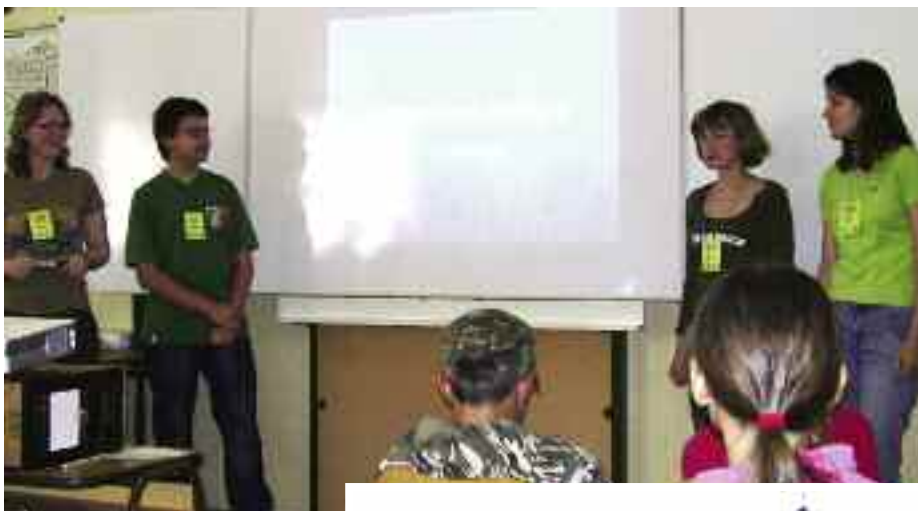
Prezentace projektu Makrozoobentos