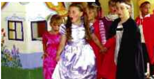
Děti z MŠ U Rybníčku hrají pohádku Popelka.