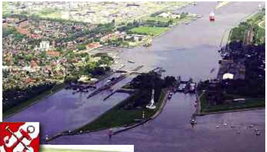
Letecký pohled na město Brunsbüttel a Nord-Ostsee Kanal, vlevo typická krajina Šlesvicka-Holštýnska

Přestože první návštěva trvala pouze jeden den, oba starostové i zástupci Brunsbüttelu a Horních Počernic se spřátelili, takže se už loučili s přesvědčením, že chtějí spolupracovat především v oblasti školství, kultury a sportu, podporovat výměnu zkušeností zaměstnanců městské správy a kontakty spolků. To vše s cílem navázat a prohloubit bezprostřed-