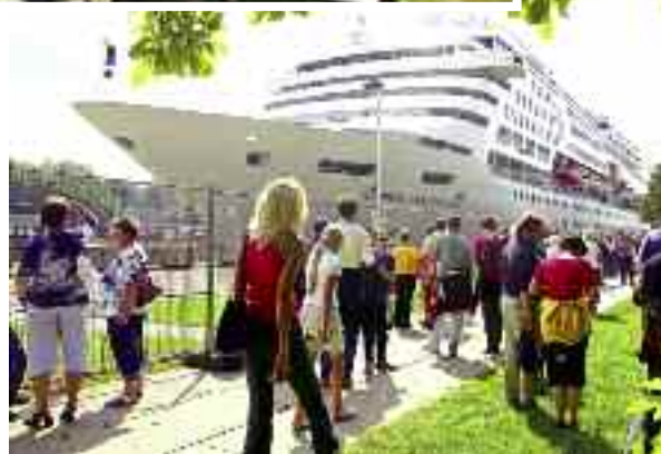
Denní realita v Brunsbüttelu: obrovské zaoceánské lodě doslova přetínají hlavní třídu města. Foto dole je z vycházky po pobřeží Severního moře v městě Büsum.