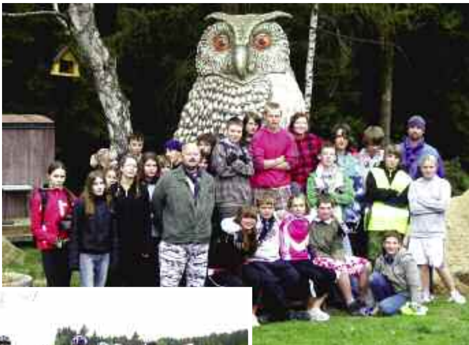
Cíle naší cesty: Tři studně, Devět skal a Zelená hora.

Druhý den se jedeme podívat na Devět skal, nejvyšší vrch v okolí. Cesta je nádherná, vede lesy a straní se veřejných komunikací, což je pro naši výpravu ideální. Cestou zpět čekáme na náš zadní voj krajinářů a závodíme s jednou slečnou mající stejný směr jako my. Jednou předjedeme my ji, podruhé ona nás. Vzhledem k tomu, že my jedeme na kolech a ona jde pěšky, to nás trochu znervozňuje. Odpoledne se jedeme podívat na klenot barokní gotiky a památku UNESCO, kostel sv. Jana Nepomuckého na Zelené hoře. Jelikož je vzdálenost pro