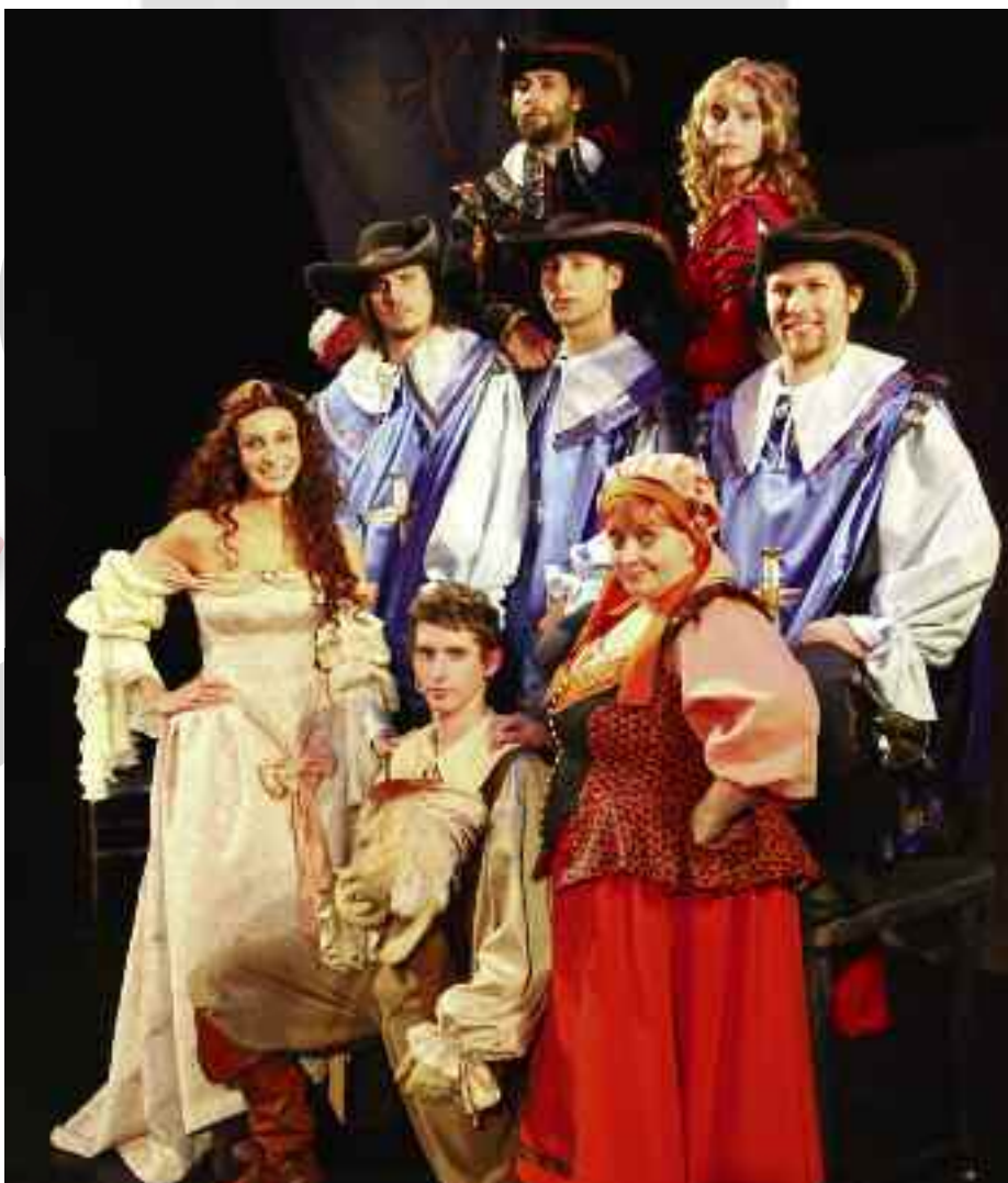
Představení Tři Mušketýři můžete vidět v úterý 22. září.