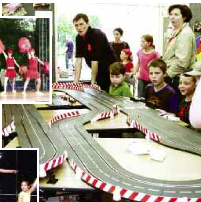
Stanoviště s autodráhou zajímalo děti i tatínky.

Na Dětském ostrově jsme měli stanoviště s autodráhou. Vyzkoušet si své řídicí umění přišly nejen děti školou povinné, ale i tatínkové, kteří se díky autodráze vrátili do svých dětských let. Lektorům i všem dětem děkujeme za vzornou reprezentaci našeho DDM.