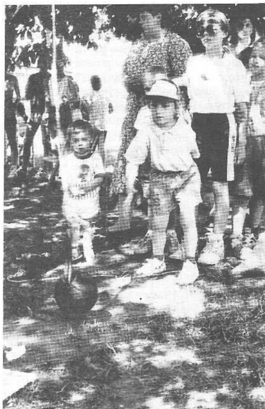
Na oslavě "Dne dětí" si všichni skutečně zasoutěžili.