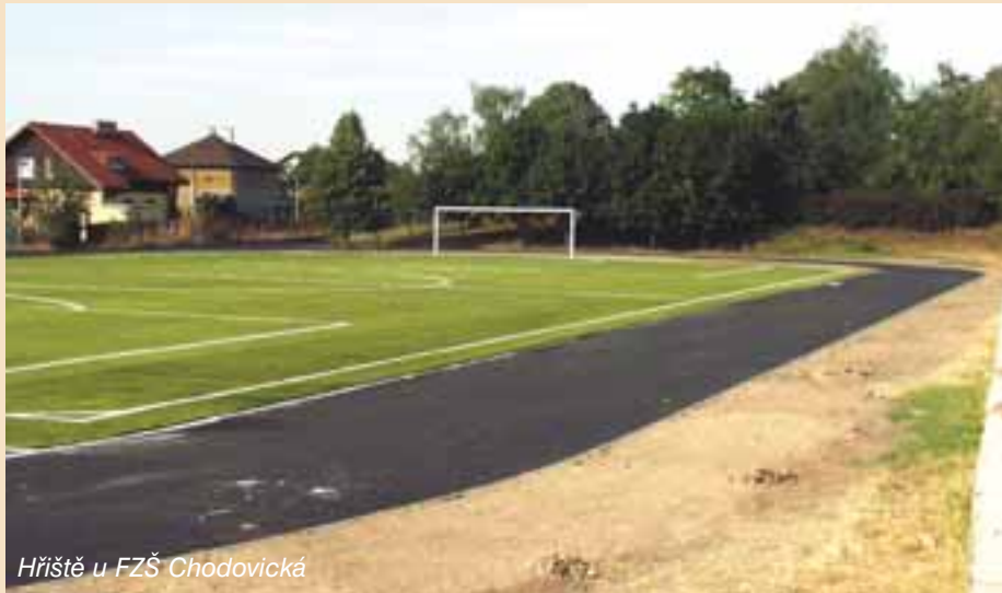
Hřiště u FZŠ Chodovická