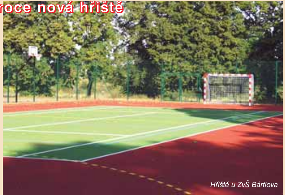
Hřiště u ZvŠ Bártlova

odbor místního hospodářství