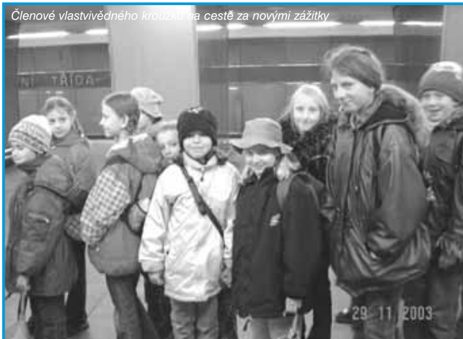
Členové vlastivědného kroužku na cestě za novými zážitky

Vlastivědný kroužek byl na naší škole založen ve školním roce 1998/1999 za účelem poznávání pamětihodností a zajímavostí Prahy a nejbližšího okolí. Zúčastňujeme se vycházek pořádaných Pražskou informační službou ve spolupráci s Národním muzeem a Galeríí hl. m. Prahy. Také v loňském školním roce jsme připravili řadu zajímavých akcí, kterých se zúčastnilo 335 dětí.