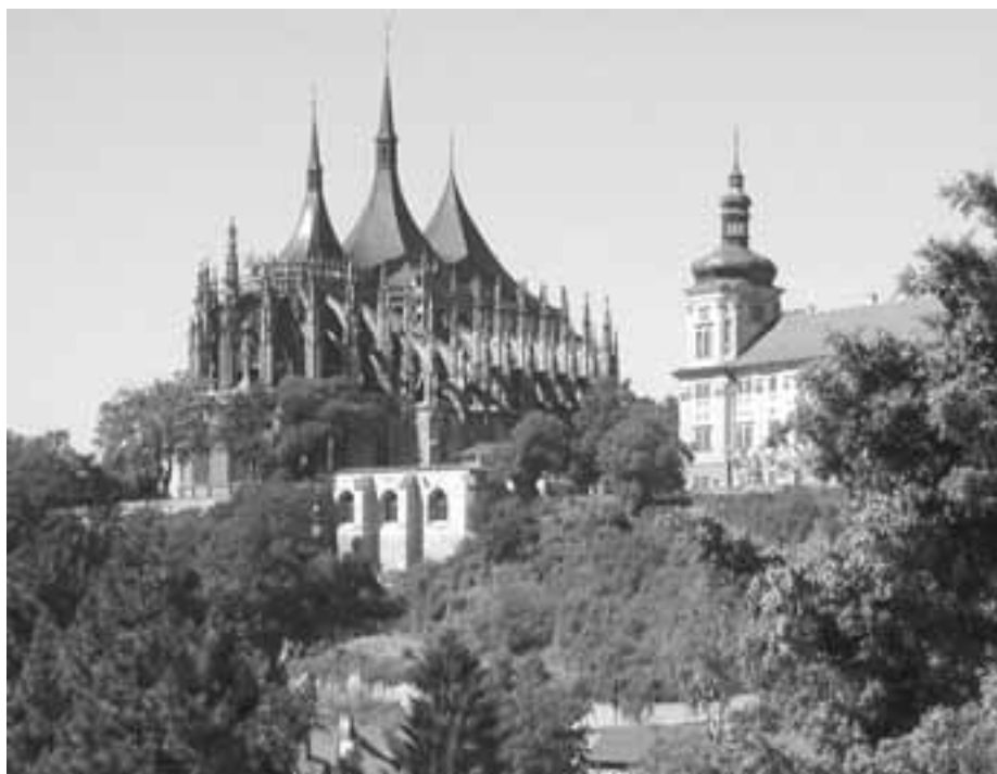
Výlet do Kutné Hory - 9. října

Mimo tyto základní činnosti pořádáme již pravidelně i aktivity příležitostné. První