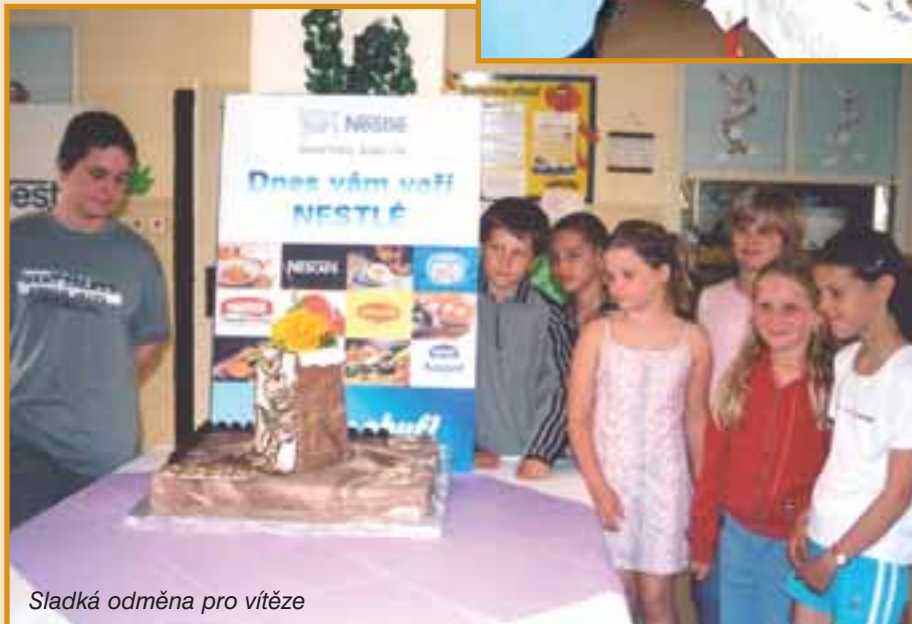
Sladká odměna pro vítěze

vat a vést je k větší odpovědnosti vůči životnímu prostředí", uvedla při tiskové konferenci.