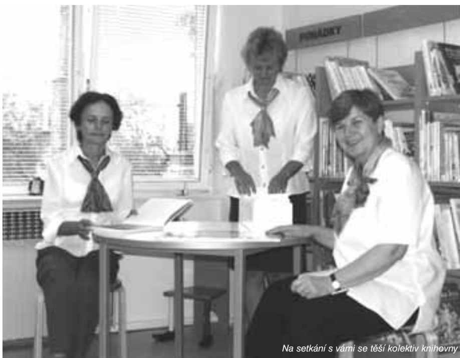
Na setkání s vámi se těší kolektiv knihovny