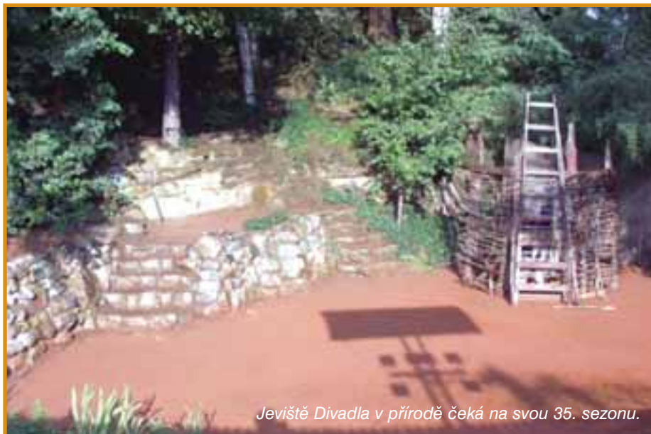
Jevišťe Divadla v přírodě čeká na svou 35. sezonu.