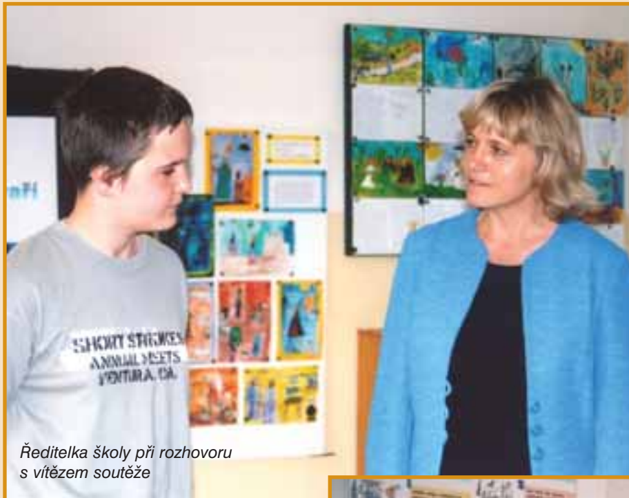
Ředitelka školy při rozhovoru s vítězem soutěže