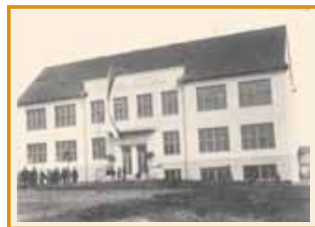
Otevření školy v roce 1934

Škola je od jara roku 1971 neodmyslitelně spojena s Divadlem v přírodě, kde se letos uskutečnil už 34. ročník divadelního