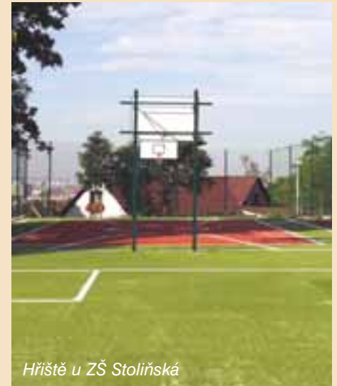
Hřiště u ZŠ Stoliňská

V tabulce uvádíme náklady na výstavbu jednotlivých hřišť.