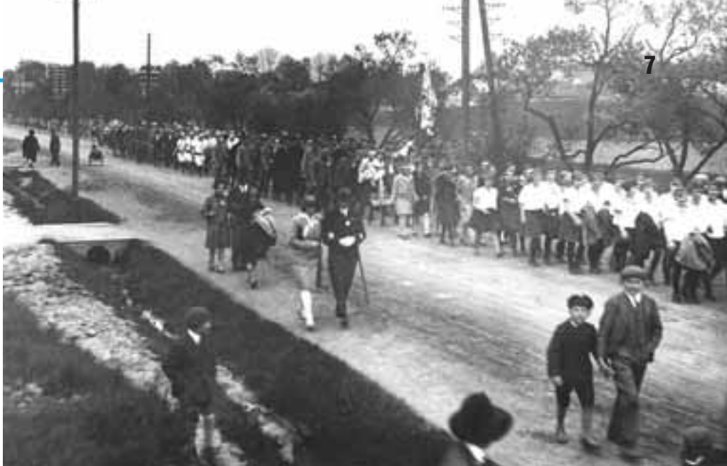
Slavnostní průvod při otevření nového letního cvičiště 13. května 1928.

Svoji činnost Sokol v podstatě nepřerušil, ale převedl ji do jiných organizací, kde pokračoval Němcům takřka "pod nosem".