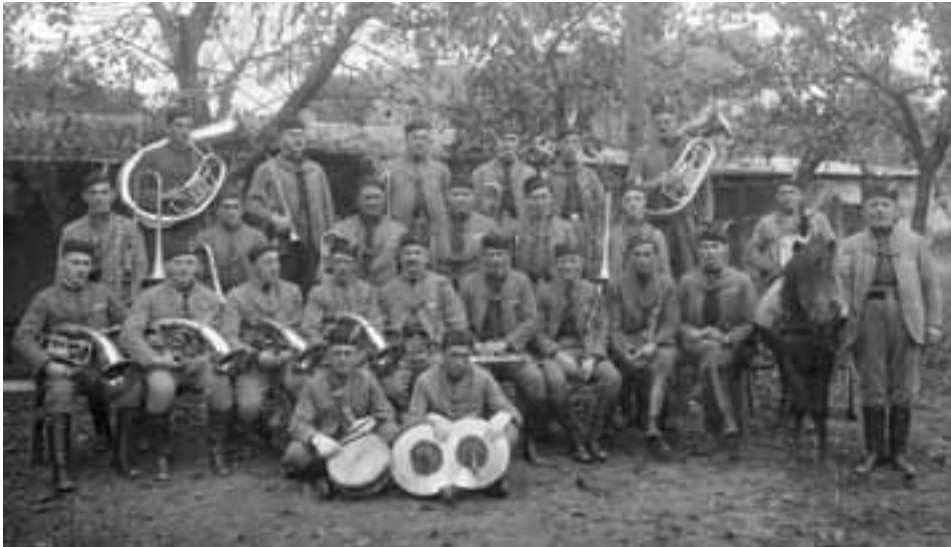
V roce 1930 byl ustaven trubačský oddíl TJ Sokol, který si až do okupace vedl velmi zdatně a reprezentoval na sletech v roce 1932 a 1938.