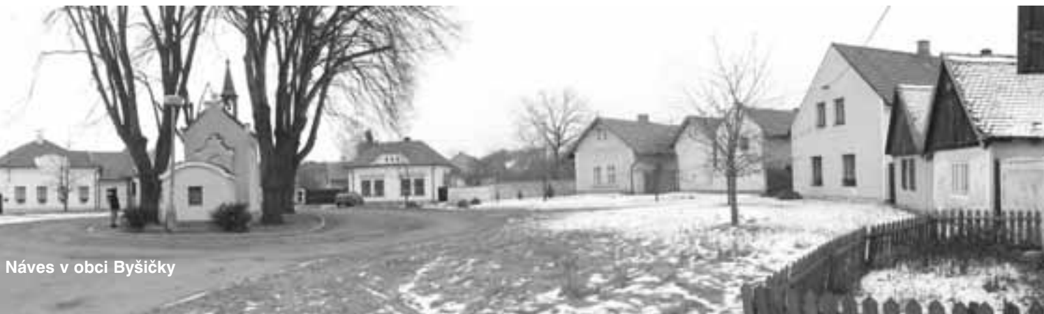
Náves v obci Byšičky