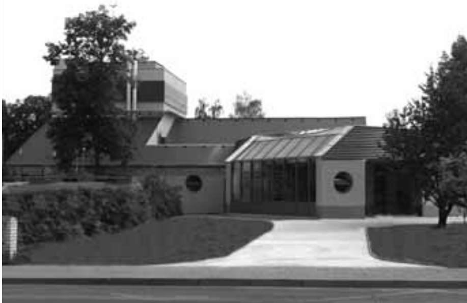
Do otevření hornopočernického divadla zbývá už jen měsíc.

Letošní volby do Parlamentu byly sledovány s velkým napětím. Preference hlavních rivalů se postupem času pomalu přibližovaly až na rozdíl statistické chyby, předvolební kampaň byla velmi emotivní především v osobní rovině. Zveřejnění výsledků však na celkovém politickém napětí nic nezměnilo.