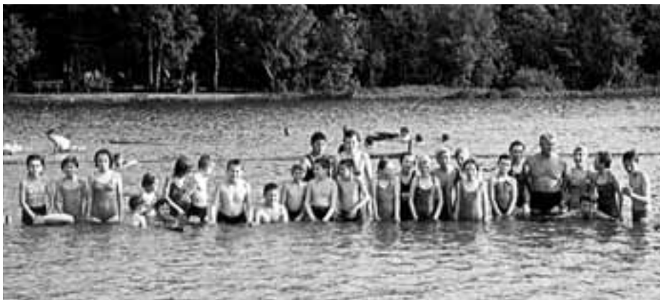
Koupaliště vybudované v roce 1954 v přírodním údolí, kde už před 250 lety byl jeden z rybníků na vodoteči Svěpravického potoka. Dodnes je oblíbeným místem ke koupání i rybolovu.