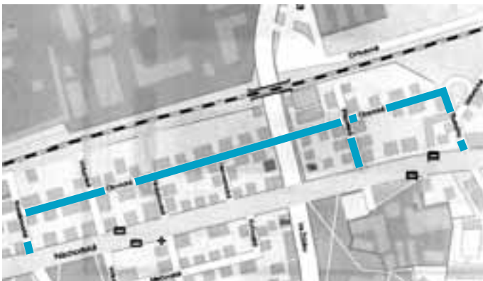
Nové povrchy komunikací a chodníky z dotací hl. m. Prahy

Městská část Praha 20 Horní Počernice obdržela dotace od hlavního města Prahy na komunikace ve výši 4,7 mil. Kč a jeden mil. Kč na chodníky. Za tyto prostředky odsouhlasila rada MČ realizaci nových povrchů na komunikacích v části ulice Rašinské u rybníka Starák v srpnu - říjnu 2006, kde náklady na část obytné zóny představují 2,34 mil. Kč., v ulici Lipí v úseku Náchodská - Obchodní v září - říjnu 2006 za 1,86 mil. Kč. V červnu byla za 368 mil. Kč opravena křižovatka Tlustého - Třebešovská. Z dotace na chodníky bude v měsících červenci - září realizován jižní chodník v ulici Běluňské v úseku Komárovská - Ve Žlíbku. Hl. m. Praha dále realizuje v roce 2006 přes odbor městského investora tyto nové komunikace: v oblasti U Věže - Karla Tomáše - Běluňská byla stavba dokončena v červnu 2006 za 12 mil. Kč, v části ulice Češovské v červnu - srpnu 2006 za 3,3 mil. Kč a v ulici Otovická, kde byla součástí 1. etapy také stavba kanalizace a nových povrchů, za 37 mil. Kč včetně kanalizace. Termín dokončení stavby kanalizace je prosinec 2006 a komunikace duben 2007.