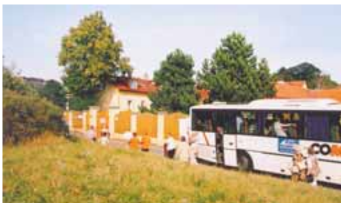
Odpoledne si francouzští hosté prohlédli LRS na Chvalech.