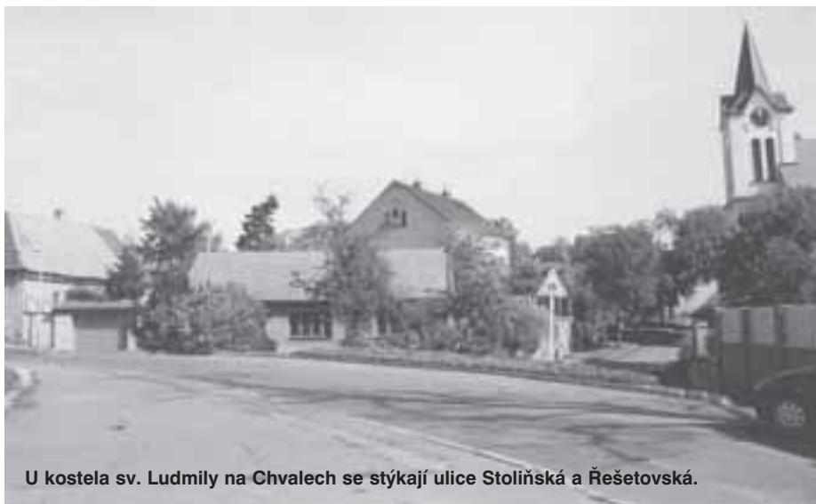
U kostela sv. Ludmily na Chvalech se stýkají ulice Stoliňská a Řešetovská.

Ulice se současným názvem Stoliňská dostala tento název při přejmenování v roce 1976 podle vsi Stolín ležící jihozápadně od Červeného Kostelce ve východních Čechách. Z jazykového hlediska byl název utvořen chybně. Při pojmenování ulic v roce 1929 dostala název Husova třída. Po spojení obcí byl název změněn na Táboritská. Současné vedení Stoliňské ulice začíná na severu u pomníku obětem 1. světové války a pokračuje jihozápadním směrem křížící ulicí Náchodskou svahem okolo základní školy až ke spojení s novou ulicí Hartenberskou u léčebně-rehabilitačního a vzdělávacího areálu Církve bratrské. Až do vybudování dálnice na Hradec Králové pokračovala tehdejší Husova třída po silnici do Dolních Počernic až na hranici katastru obce Chvaly. Ulice s dnešním názvem Vršovka byla takto pojmenována v roce 1976 podle vsi stejného jména, která se nachází jižně od Nového Města nad Metují ve východních Čechách. Od roku 1929 nesla název Školská. Je to krátká ulice