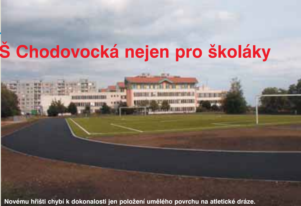
Novému hřišti chybí k dokonalosti jen položení umělého povrchu na atletické dráze.

Ocení ho především žáci našich sportovních tříd, kteří mají možnost trénovat na téměř profesionálním sportovišti. Jeho