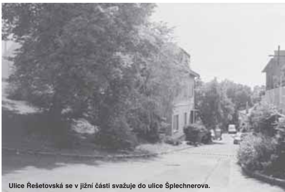
Ulice Řešetovská se v jižní části svažuje do ulice Šplechnerova.