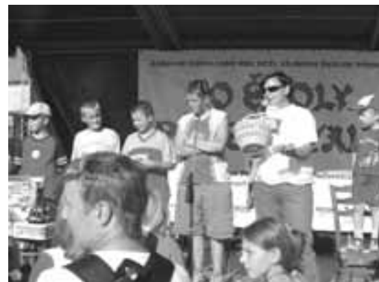
Chvilu napětí před losováním