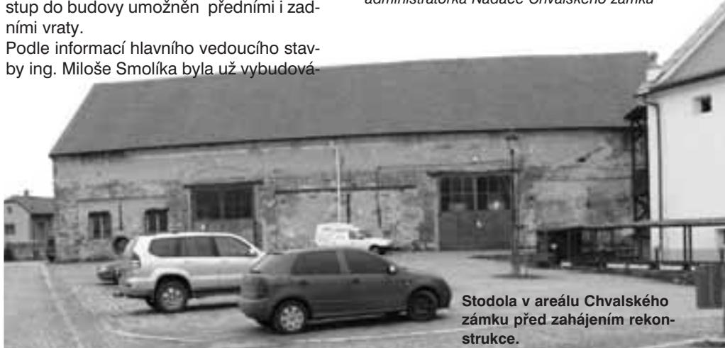
Stodola v areálu Chvalského zámku před zahájením rekonstrukce.