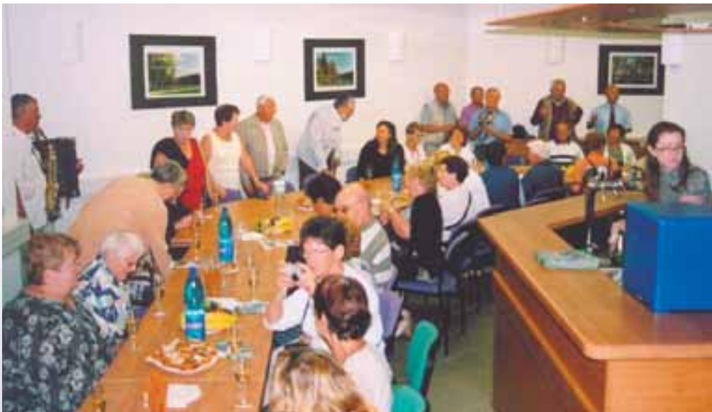
Zasedací místnost počernické radnice zaplnili francouzští hosté do posledního místa.