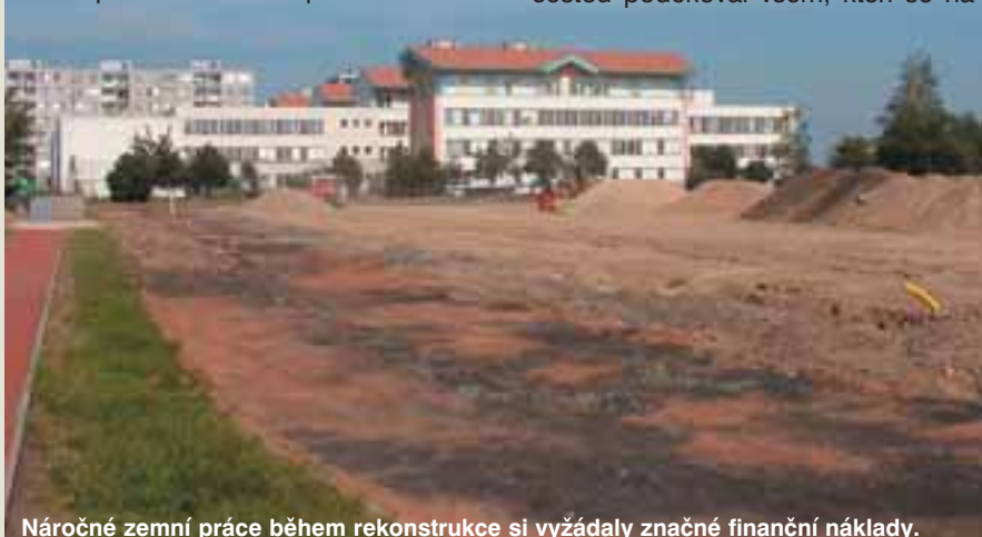
Náročná zemní práce během rekonstrukce si vyžádaly značné finanční náklady.