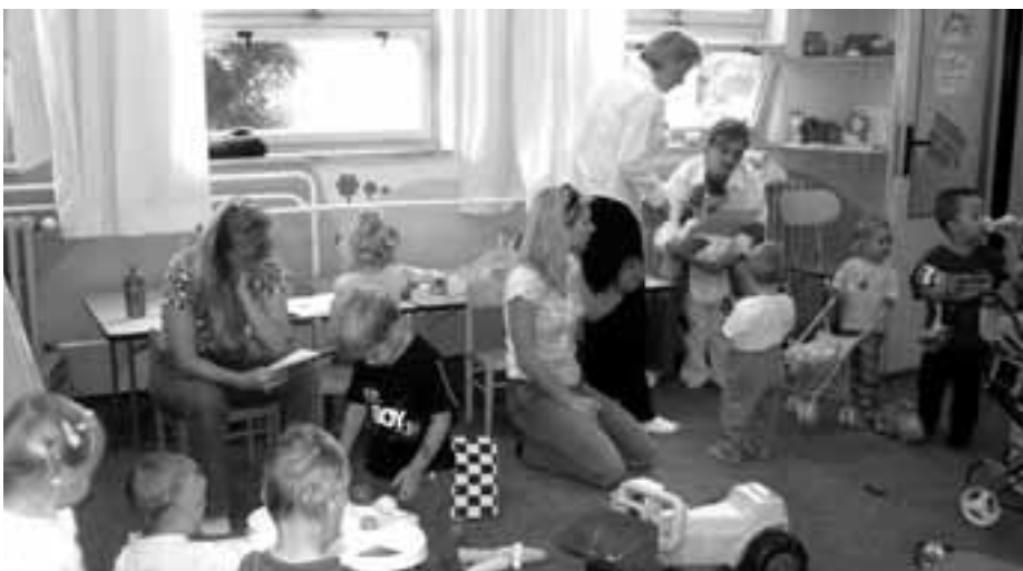
Den otevřených dveří v mateřském centru se setkal s velkým zájmem.

Burza zimních potřeb (kočárky, lyže, brusle, sáně a boby) bude 2.11.2006.