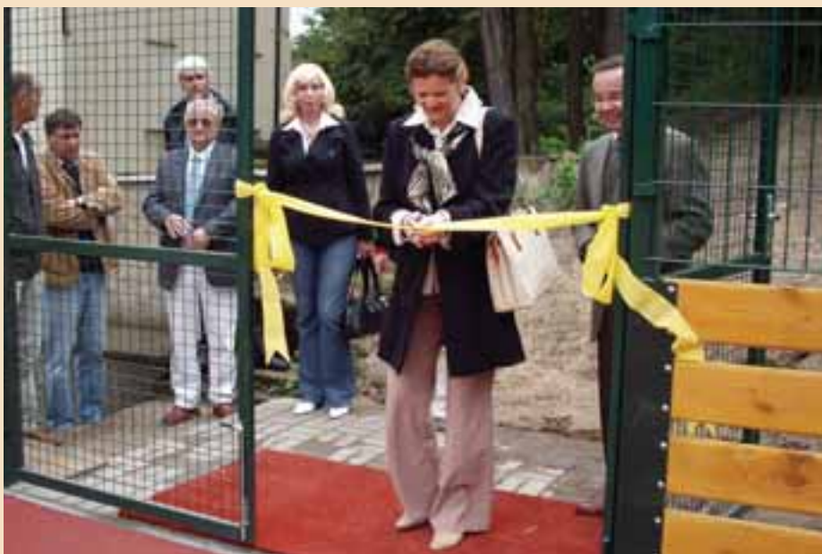
Od září mají studenti SOŠ pro EU k dispozici nové sportovní hřiště.

Péče o studenty zahrnuje i nabídku kvalitní stravy v příjemném prostředí a možnost sportovního vyžití. O letošních prázdninách proto proběhla rozsáhlá rekonstrukce školní kuchyně SOŠ pro EU v Horních Počernicích v hodnotě 12 milionů Kč, které poskytlo hlavní město Praha, dále rekonstrukce školního hřiště na odloučeném pracovišti v Hrdlořežích za 1,4 mil. Kč, částečně hrazená z grantu hl. m. Prahy a částečně z prostředků školy. Jedná se o kompletní přestavbu vnitřního