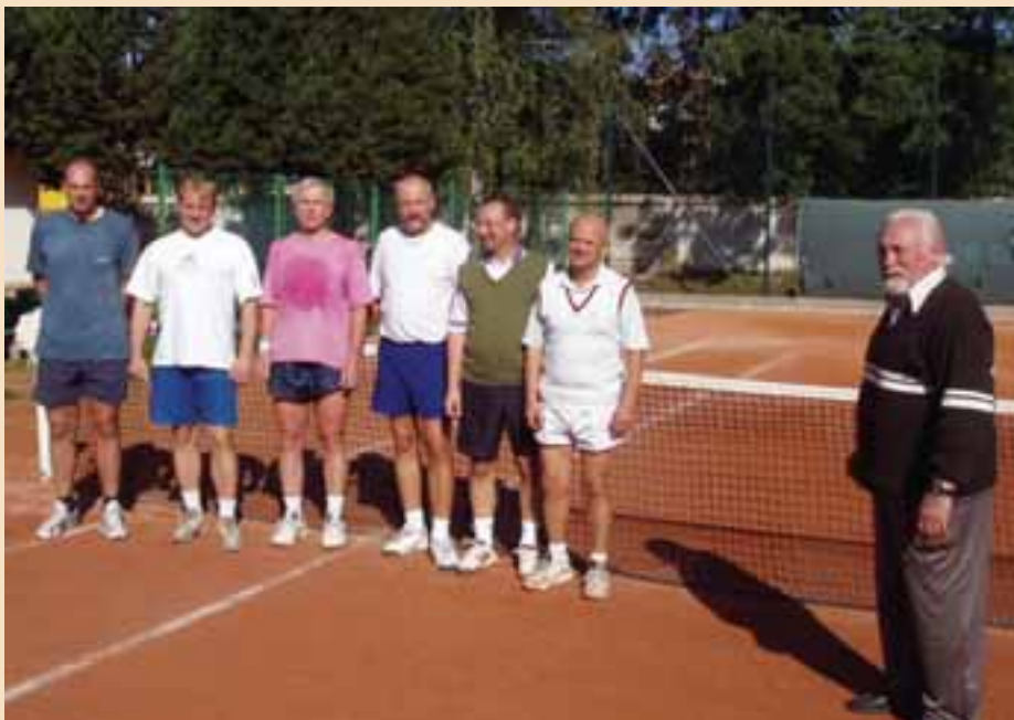
Účastníci čtyřhry s ředitelem turnaje.