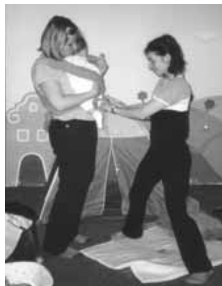
Kurz vázání miminek do šátku.

ve střeďečním klubu MIMÍK Třídílný kurz masáží miminek pod vedením odbornice. Masáže dětí pomáhají upevnit jejich zdraví a současně prohlubují citové vazby a vzájemnou důvěru mezi vámi a vaším děťátkem. Naučte se správně masírovat své miminko, vždyť dotyky jsou jeden z nejdůležitějších způsobů komunikace, kterým přijímá vaši