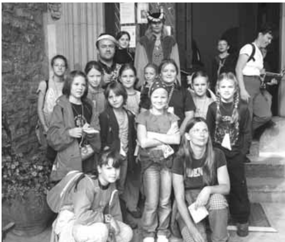
Děti z počernického DDM na setkání pražských domů dětí a mládeže v Kutné Hoře Hornopočernický zpravodaj

Aktuální termíny jsou vždy na našich webových stránkách.