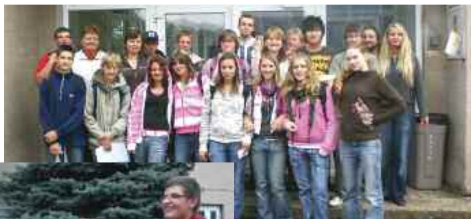
Studenti SOŠ v Lipí připravili Svatojánskou pouť pro děti ze školy v Bártlově ulici.