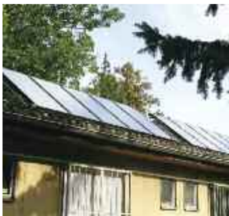
Montáž solárních kolektorů na ohřev teplé vody.