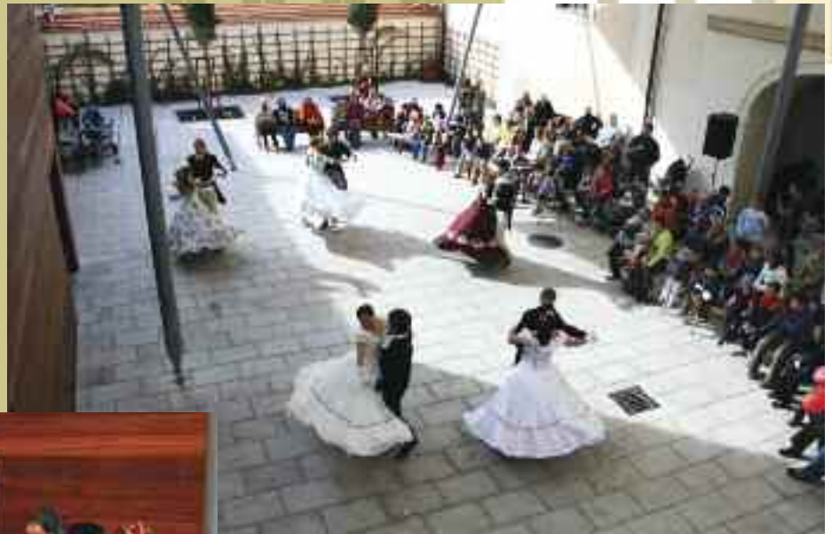
Na nádvoří Chvalského zámku se tančily renesanční, barokní, cikánské, ale i společenské tance.

Počátkem října se na Chvalském zámku konaly už podruhé historické slavnosti. V letošním roce byly zahájeny divadelním představením Zkrocení zlé ženy v podání souboru historického tance Regii Caroli Regis. Úsměvná adaptace klasické Shakespearovské hry plná tance, zpěvu ale i šermu rozehrála srdce odvážných návštěvníků, kteří přišli navzdory velmi chladnému počasí v hojném počtu na nádvoří