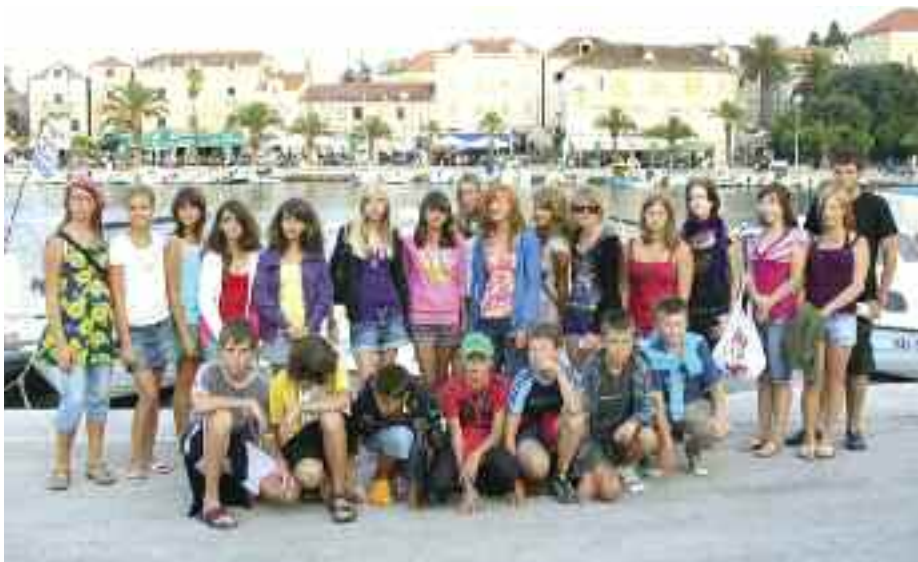
Studenti gymnázia v Chorvatsku a v Krkonoších