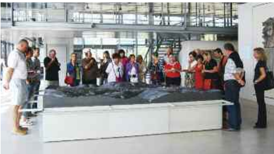
Muzeum antických památek Saint-Romain-en-Gal ve Vienne Hornopočernický zpravodaj

Následující den patřil návštěvě Lyonu. Dojem z hlavního města francouzského regionu Rhône-Alpes nikomu nezkazila ani stávka dopravců, protože metro je zde řízeno automaticky a jezdí tedy bez řidiče. Lanovka na kopec Fourvière zastavuje přímo v centru římského Lyonu, cesta pak vede dále nahoru po Chemin de la Rossé až k bazilice Panny Marie z Fourvière. Odtud se nabízejí úžasné výhledy na pamětihodnosti města, především vysoko se tyčící věže katedrály sv. Jana. Na každého zapůsobila i procházka Starým Lyonem, čtvrtí s úzkými uličkami, pasážemi a prohlídkou středověkých či renesančních domů. To vše bylo zakončeno ochutnáv-