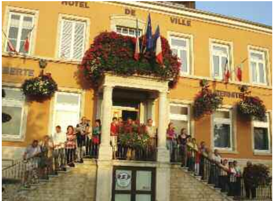
Příjezd frekventantů kurzu na radnici v Mions, vlevo antické divadlo v městě Vienne