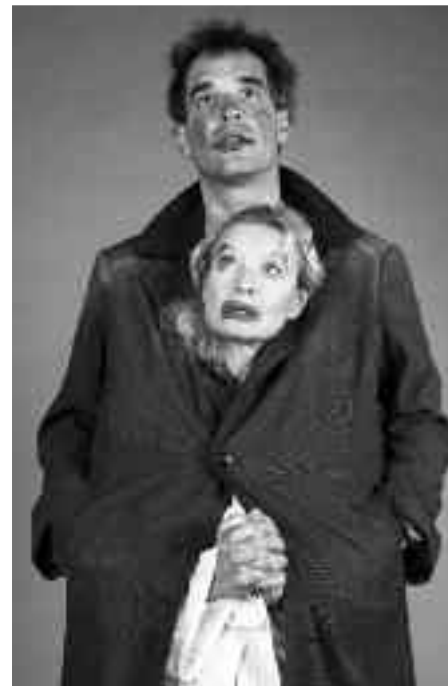
Vilma Cibulková a Miroslav Etzler v představení Všechno jen do putyk a ženským