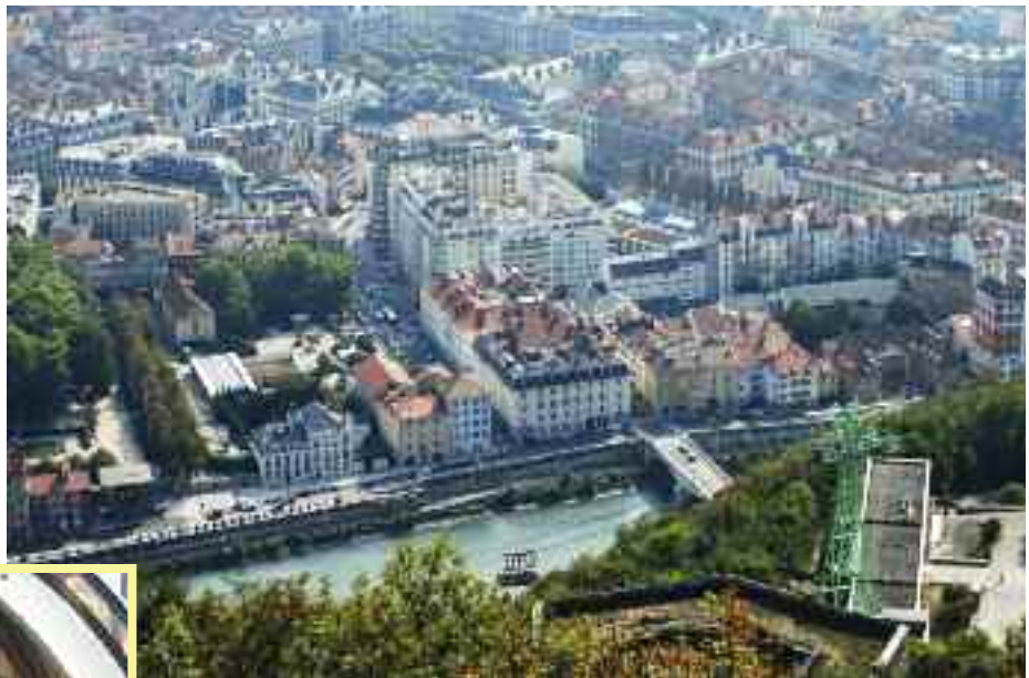
Jízda lanovkou k pevnosti Fort de la Bastille nad řekou Isere je výjimečným zážitkem, stejně jako překrásný výhled na Grenoble. Dole kraj mezi Lyonem a Mâconem, kde se rodí Beaujolais.

V režii jednotlivých rodin byl také program posledního dne. Mionští nabídli studentům nádherné výlety do Grenoble, města položeného v údolí a obklopeného pohorymi francouzských Alp Vercors, Belledone