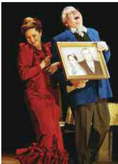
Sobota 14.11. v 19.30 MANŽELSTVÍ NA ZKOUŠKU