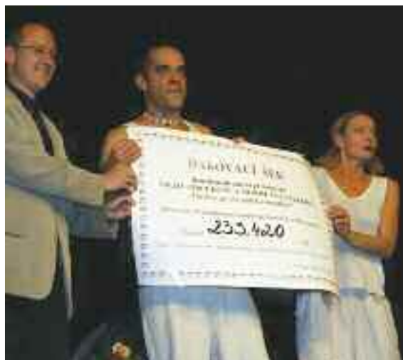
Díky benefici získalo Středisko 233.420 Kč.