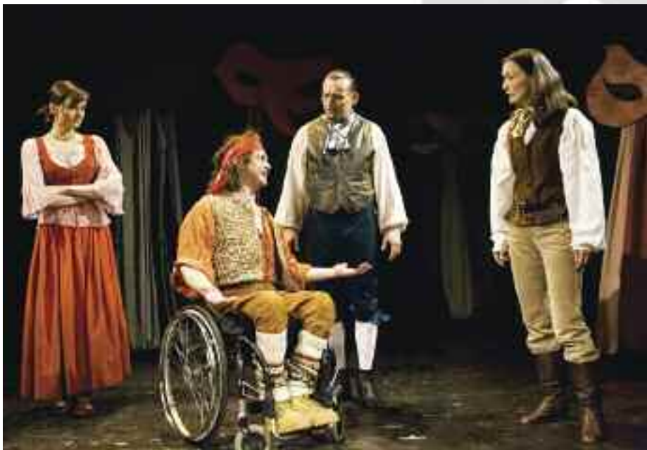
Středa 9. prosince v 19.30, SLUHA DVOU PÁNŮ