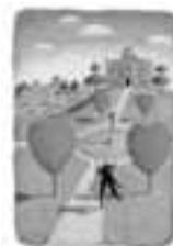
ZATANCUJ SI SE MNOU