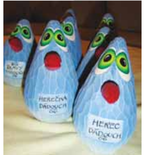
Keramické sošky ceny Dádouch 2007 čekají na své letošní vítěze.