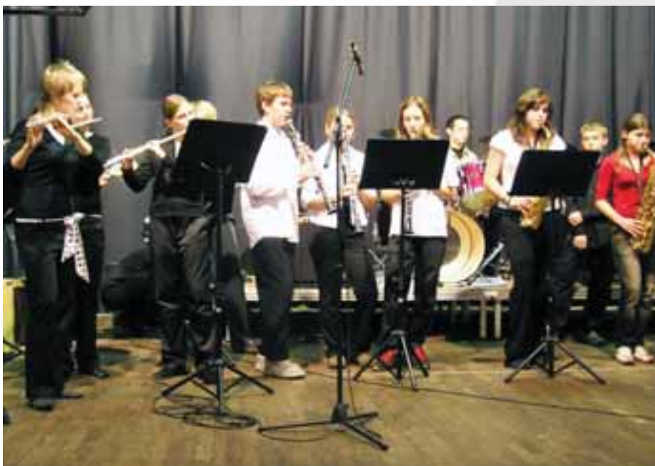
Junior Band, ZUŠ Horní Počernice