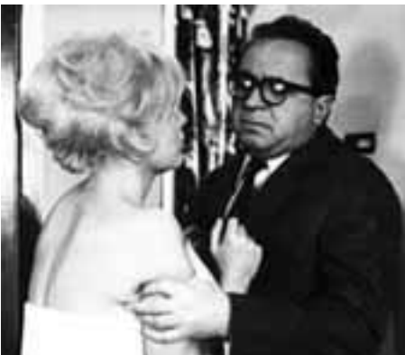
Kinoautomat hitem EXPO '67