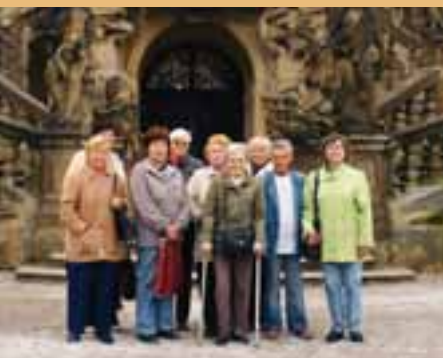
Fotografie z našich výletů do Mníšku pod Brdy a Trojského zámku