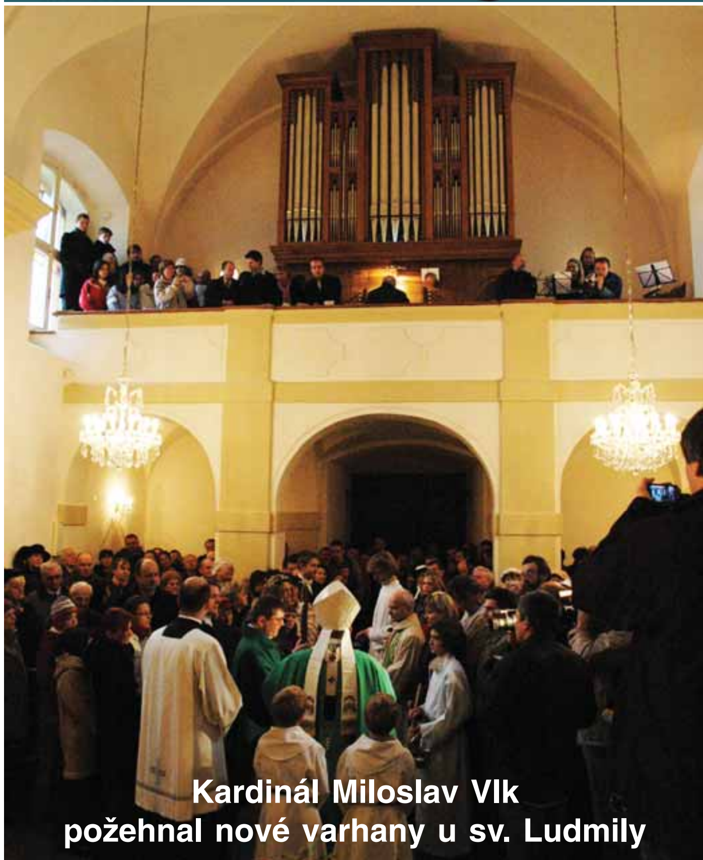
Kardinál Miloslav Vlk požehnal nové varhany u sv. Ludmily