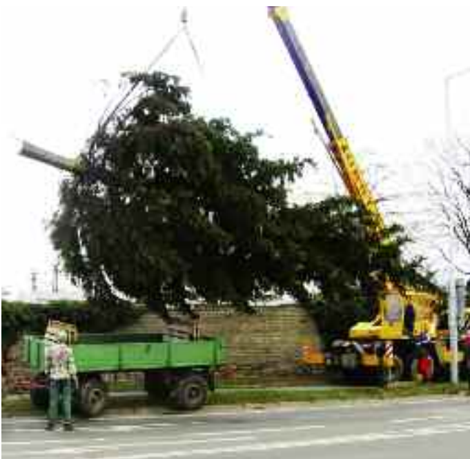
Od 17. listopadu zdobí areál Chvalseké tvrze vánoční strom.

Sváteční den 17. listopadu je pravidelně pro většinu pracovníků místního hospodářství pracovním dnem. V tento den, kdy je na Náchodské ulici menší provoz, je vánoční strom převážen a usazován do areálu Chvalseké tvrze. Letos byl vánoční strom použit z Chvalsekého hřbitova, kde jej bylo nutno odstranit z důvodu poškozování sousedících hrobů a hrozilo zřícení stromu do prostoru hřbitova při silném větru. V současné době byl