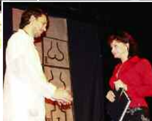
Nahoře: Muzikál Výtečníci Vlevo: DS Pódio Semily s představením Uděláte mně to znova?