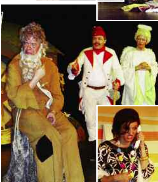
Nahoře: My dva /DS Scéna Libochovice/ Vlevo: Doslova nabito bylo na představení Hrátky s čertem v podání DS Jiří Poděbrady