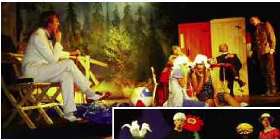
Nahore: Rozmarné léto /DS Jirásek Nový Bydžov/ dole: Alenčiny rošády /DS Svatopluk Benešov/