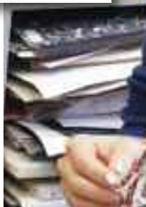
Brož, prsten, náramek a náhrdelník, šperky z PET lahve, starého časopisu, příze a zbytků papíru.