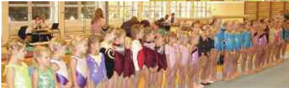
Nástup nejmenších závodnic na soutěži v Horních Počernicích