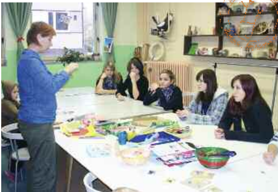
V mateřském centru si děvčata vyrobila krásné a přitom ekologické šperky.

Sběr baterií již na škole probíhá, a tak jsme se rozhodli, že k tomu ještě přidáme možnost sběru starých elektrospotřebičů. Ve vstupní hale velké budovy je umístěna červená popelnice, do které patří vysloužilé telefony, mp3, kalkulačky, klávesnice