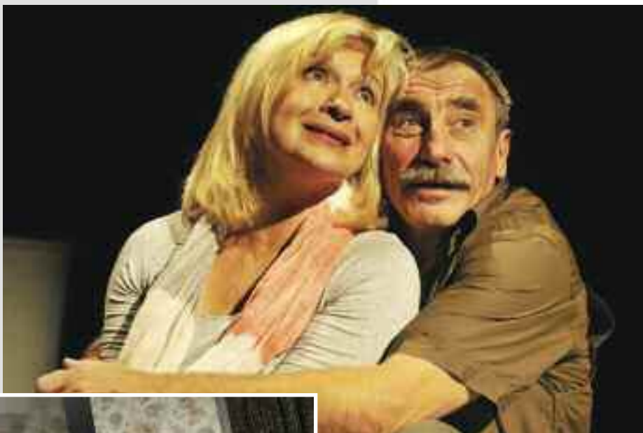
Jana Paulová a Pavel Zedníček ve hře Noela Cowarda Zamilovat se Vlevo: Jan Vlasák a Zdeněk Maryška v komedii Kontrola nemocného

Dopolední představení zadaná pro školy a školky: