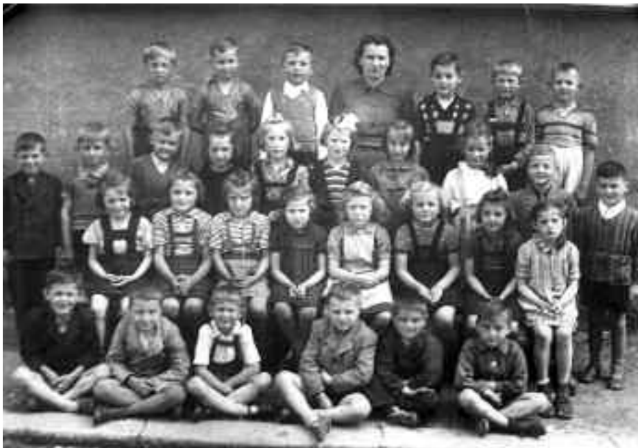
Pro mnohé bylo až dojemné, když se viděli na fotografiích ze školních let.

Pro mnohé bylo až dojemné, když se viděli na fotografiích ze školních let. Ty nám