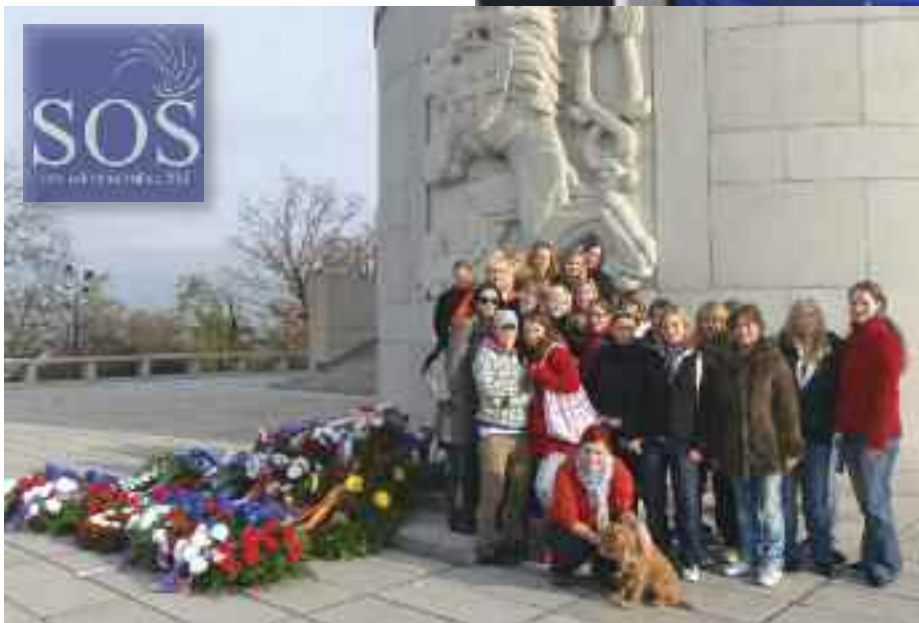
Od 29. října je v Národním památníku na Vítkově stálá expozice s názvem Křížovky české a československé státnosti.