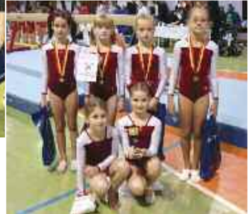
Mladší žákyně na přeboru Prahy