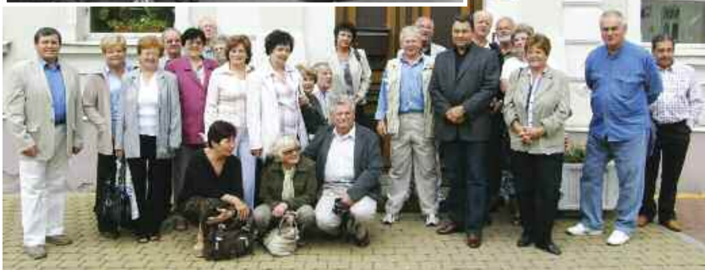
Na další společnou fotografii si bývalí spolužáci počkali více než padesát let.