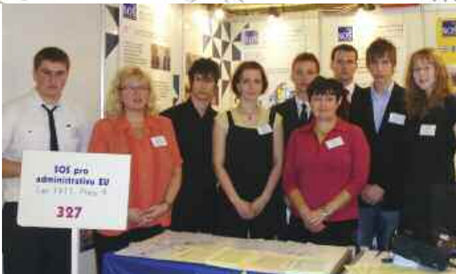
Studenti na veletrhu pražských středních škol a odborných učilišť Schola Pragensis