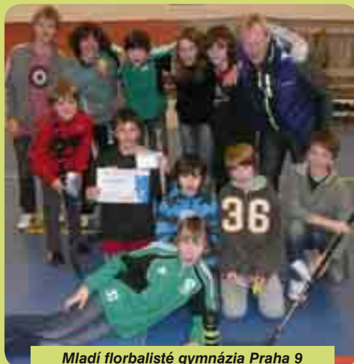
Mladí florbalisté gymnázia Praha 9